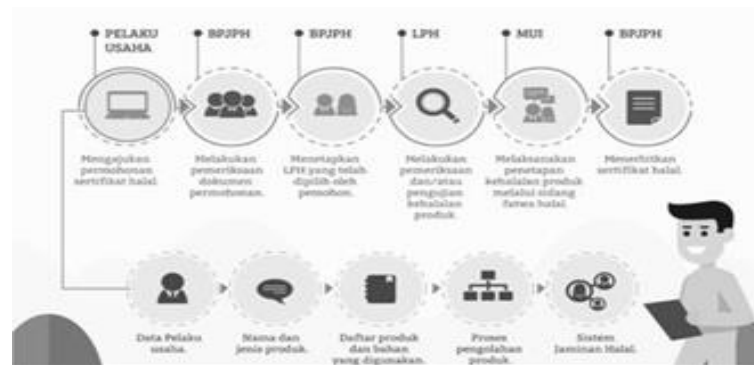
Gambar 2. Skema Permohonan Sertifikasi Halal

Sertifikasi halal adalah kehalalan terhadap produk tersebut tergantung pada terpenuhinya atau tidaknya sertifikasi halal tersebut. 10 Sertifikasi halal menjadi hal yang paling diutamakan bagi pelaku usaha sehingga menarik minat beli konsumen terhadap produk makanan dan minuman yang ditawarkan. Pelaku usaha yang ingin produknya memiliki sertifikasi halal harus melibatkan 3 pihak yang terkait sebagai lembaga pemeriksa halal (LPH) yaitu BPJPH, LPPOM dan MUI. 11 Berikut skema proses permohonan sertifikasi halal kerja sama antara BPJPH, LPH dan MUI: