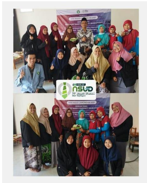
Gambar 3. Foto Anggota KKN Insud bersama perwakilan wali santri dan pengasuh saat pelatihan pembuatan brownis Twenty ABCD.