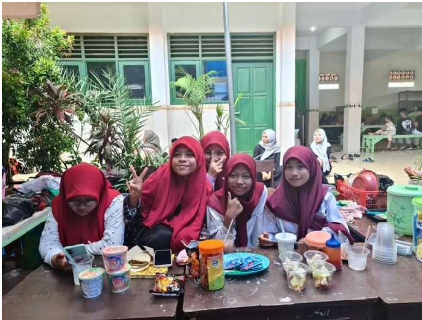
Gambar 4. Persiapan Bazaar

Gambar 3 dan 4 menunjukkan persiapan pelaksanaan kegiatan pekan wirausaha dan pentas seni. Dalam gambar 3 menunjukkan cek akhir kesiapan pentas seni kemudian di gambar 4 memperlihatkan anak-anak sedang mempersiapkan stand bazaar.