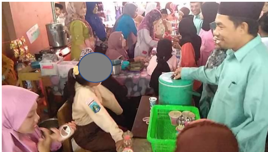
Gambar 5. Kepala Madrasah dan Dewan Guru Mengunjungi Stand Bazaar

Pada gambar 5 menunjukkan Kepala Madrasah dan wali kelas melaksanakan kegiatan pendampingan dan kunjungan ke stand bazaar siswa. Dalam kunjungan ini Kepala Madrasah dan Wali Kelas memberikan motivasi dan arahan-arahan kepada siswa.