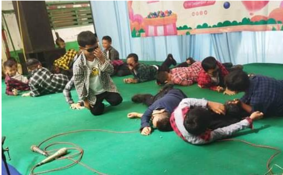
Gambar 3. Latihan Pentas Seni