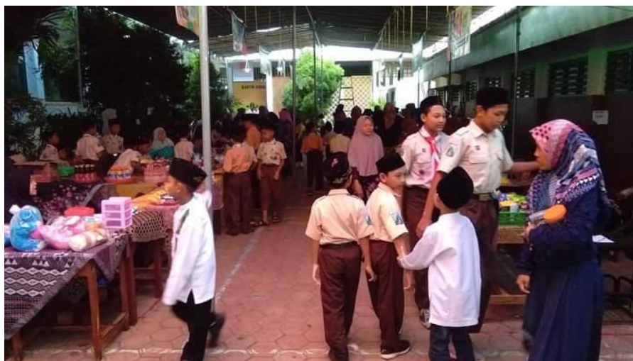
Gambar 6. Hari Terakhir Kegiatan Pekan Wirausaha dan Pentas Seni

Kegiatan 4 adalah pasca kegiatan. Pendampingan dilakukan ketika menginventarisir barang-barang dagangan di bazar. Melakukan rekap keuangan. Bersama-sama siswa melakukan evaluasi kegiatan secara keseluruhan.