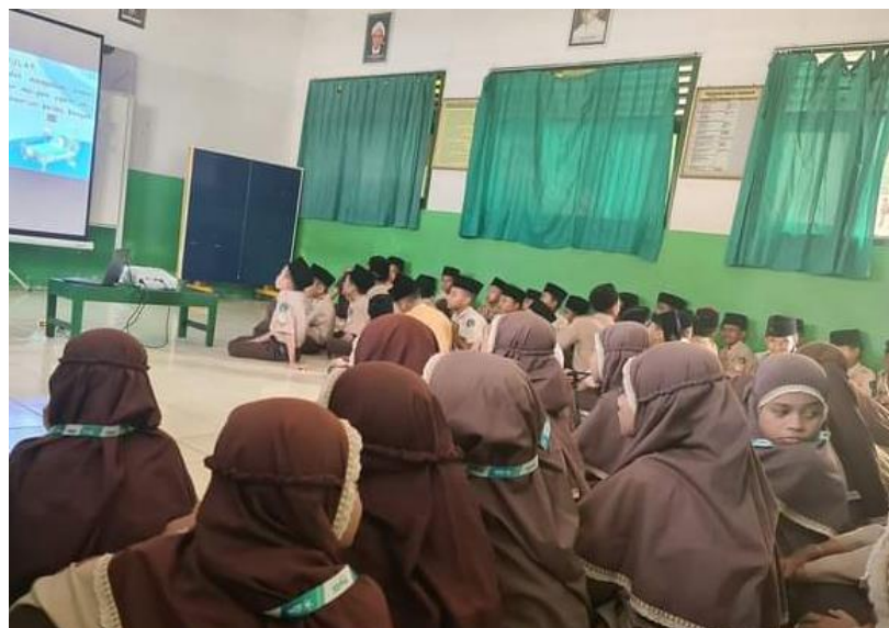
Gambar 2. Sosialisasi Pra Kegiatan Pekan Wirausaha dan Pentas Seni

Gambar 2 menunjukkan kegiatan sosialisai pekan wirausaha dan kreasi seni. Dalam penjelasan tentang pengelolaan bazaar dijelaskan tentang tujuan bazaar yaitu untuk memasarkan produk kelas. Produk apa saja yang boleh dan bisa diperjualbelikan, menjelaskan tentang potensi hasil yang diperoleh membantu kalkulasi kebutuhan modal, pemilihan produk yang memungkinkan dan diperbolehkan untuk diperjualbelikan dan membantu siswa mengatur jadwal penugasan di bazaar.