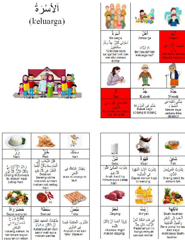
Gambar 5 : Hasil revisi: