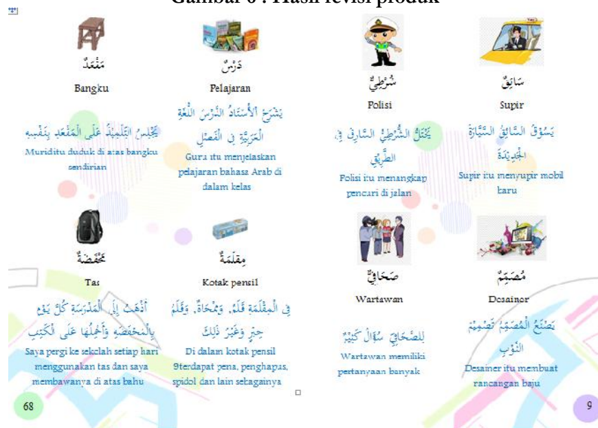
Gambar 6 : Hasil revisi produk