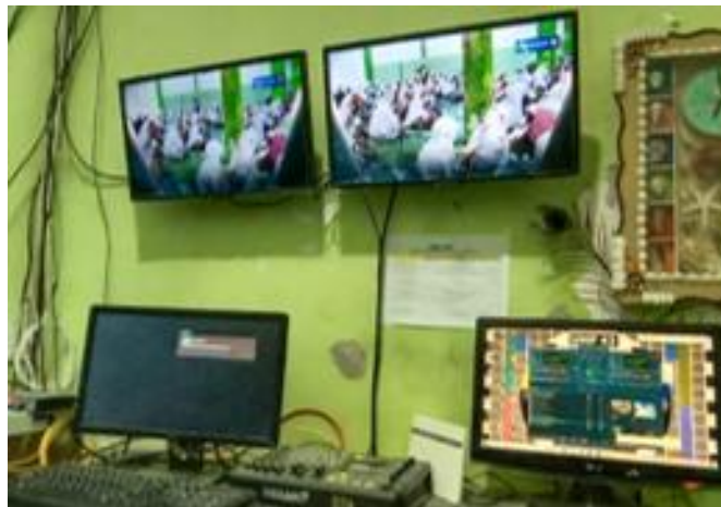
Gambar 1. Tampilan visual proses pembelajaran Al Qur'an santri putri di Madrasatul Qur'an Pondok Pesantren Sunan Drajat Lamongan saat tayang di PERSADA TV (di dua layar atas)

Dari hasil revisi yang dipresentasikan lagi, tingkat kelayakan produk video yang dihasilkan bertambah baik dan menjadi sangat layak untuk dipublikasikan atau disebarluaskan melalui televisi PERSADA TV. Bukti penayangan produk video karya tim peneliti dan pengembang yang tergabung dalam kegiatan Praktik Kerja Lapangan Program Studi Komunikasi dan Penyiaran Islam Institut Pesantren Sunan Drajat Lamongan serta Pendidikan Teknik Informatika Universitas Trunojoyo Madura dapat dilihat dalam gambar penayangan di studio televisi PERSADA TV berikut: