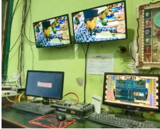
Gambar 2. Tampilan visual proses pembelajaran Al Qur'an santri putra di Madrasatul Qur'an Pondok Pesantren Sunan Drajat Lamongan saat tayang di PERSADA TV (di dua layar atas)