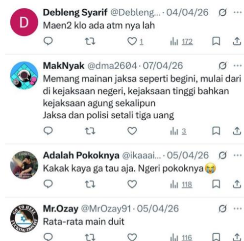
Gambar 3. Dominasi komentar emosional yang ditandai oleh generalisasi dan ekspresi ketidakpercayaan terhadap institusi hukum

Namun, temuan paling dominan adalah komentar emosional-subjektif, yang ditandai oleh generalisasi, ekspresi kemarahan, dan ketidakpercayaan terhadap institusi hukum. Dominasi kategori ini menunjukkan bahwa diskursus yang terbentuk lebih dipengaruhi oleh emosi dibandingkan rasionalitas.