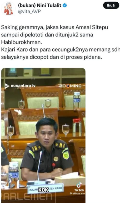
Gambar 1. Postingan akun @vita_AVP yang memproduksi konten jurnalistik dengan penambahan narasi subjektif bernuansa emosional

Fenomena ini menunjukkan adanya pergeseran dari informasi berbasis fakta menuju opini berbasis persepsi. Dalam konteks ruang publik digital, kondisi tersebut sejalan dengan argumentasi Zizi Papacharissi yang menyatakan bahwa ruang publik virtual cenderung bersifat afektif ( affective publics ), di mana ekspresi emosi menjadi elemen dominan dalam pembentukan opini publik (Papacharissi, 2015).