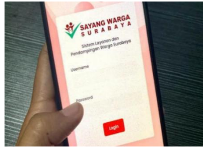
Gambar. 2 Tampilan Beranda Aplikasi SayangWarga 12

Struktur birokrasi yang berjenjang dari Wali Kota hingga kecamatan dan kelurahan mencerminkan prinsip Organizing, di mana pembagian tugas yang jelas dan adanya dukungan aparat keamanan menunjukkan pengorganisasian yang efektif. Proses administrasi kependudukan yang dijalankan oleh Dispendukcapil dengan sistem pengawasan dan verifikasi ketat serta penggunaan aplikasi "Sayang Warga" untuk pelaporan dan monitoring kinerja sesuai dengan prinsip Reporting dan Coordinating, yang memastikan komunikasi dan kontrol berjalan lancar.