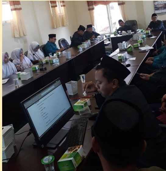
Gambar 1. Pertemuan dengan pihak terkait

Kami melakukan pertemuan dengan pengasuh pondok pesantren kanak-kanak putra Darussalam, pengurus pesantren, serta guru SD Darussalam Blokagung. Guru SD Darussalam dilibatkan karena aktivitas santri pondok kanak-kanak, selain berkegiatan di pesantren juga menempuh pendidikan dasar di SD Darussalam Blokagung Banyuwangi.