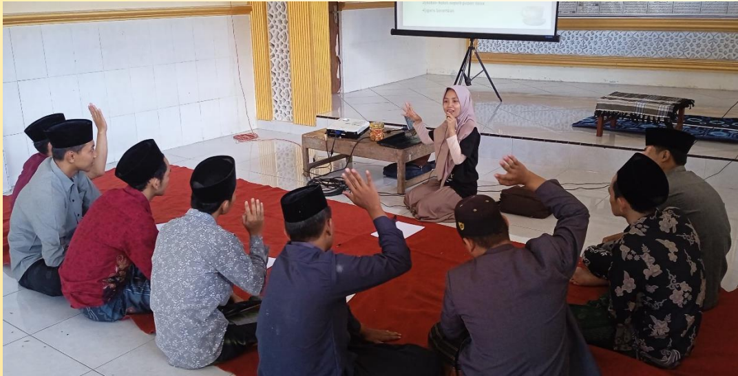
Gambar 3. Pelatihan Keterampilan Pengasuhan oleh Dosen Prodi BKI

terkait materi ini, kami melakukan rolplay mendengar aktif, hingga kami menyampaikan contoh penyampaian kalimat yang efektif.