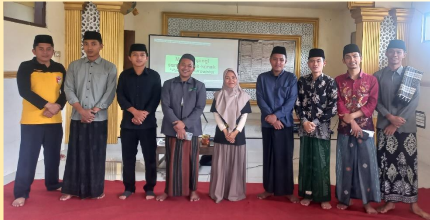
Gambar 2. Foto bersama dengan pengurus kanak-kanak

Program pelaksanaan pelatihan pengasuhan dilakukan pada 17 Desember 2023. Materi dibawakan oleh dosen program studi Bimbingan dan Konseling Islam Universitas KH. Mukhtar Syafaat. Terdapat tiga materi yang dibawakan yaitu perkembangan anak, membangun nilai positif anak, hingga pengembangan keterampilan komunikasi dengan anak.