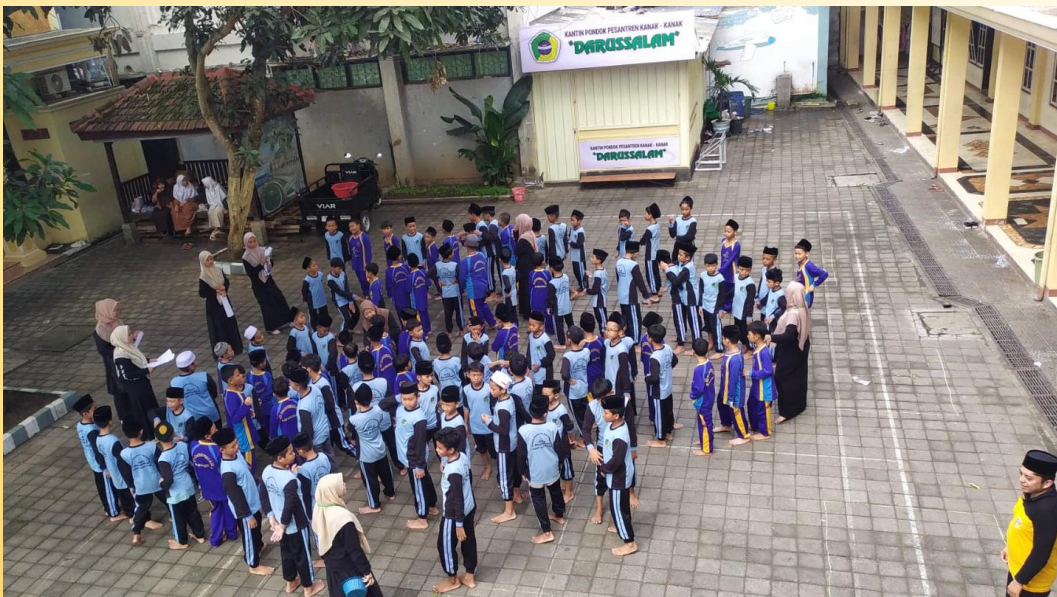
Gambar 4. Santri Kanak-kanak bermain bersama mahasiswa

Sementara para pengurus mengikuti pelatihan, sebanyak 103 santri kanak-kanak bermain bersama mahasiswa (gambar 4).