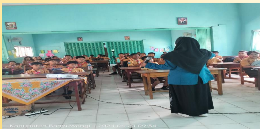
Gambar 1. Penyampaian materi motivasi berprestasi

Seminar dimulai dengan penyampaian materi seminar motivasi, yang berfokus pada pentingnya memiliki motivasi berprestasi sejak dini. Narasumber menjelaskan konsep dasar motivasi berprestasi, termasuk bagaimana motivasi dapat mendorong seseorang untuk terus belajar, berusaha, dan mencapai hasil terbaik dalam pendidikan dan kehidupan sehari-hari. Dalam sesi ini, disampaikan pula contoh-contoh nyata dari tokoh inspiratif yang berhasil karena memiliki motivasi tinggi, serta bagaimana peserta dapat menerapkan prinsip-prinsip tersebut dalam kehidupan mereka. Penyampaian materi dilakukan secara interaktif dengan diskusi ringan, untuk memberikan kesempatan kepada peserta mengungkapkan tantangan dan impian mereka terkait prestasi.