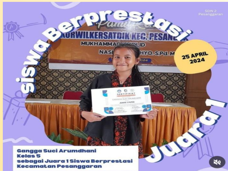
Gambar 3. Bukti dari peningkatan akademik siswa

Berdasarkan wawancara diatas Seminar Motivasi Berprestasi berhasil meningkatkan kompetensi sosial-emosional siswa. Sebelum Seminar, banyak siswa kesulitan dalam motivasi dan manajemen emosi yang memengaruhi prestasi akademik. Namun, setelah Seminar, terjadi peningkatan signifikan dalam cara mereka mengatasi tugas-tugas akademik. Adapun bukti dari peningkatan akademik ditunjukkan dengan dokumentasi sebagai berikut: