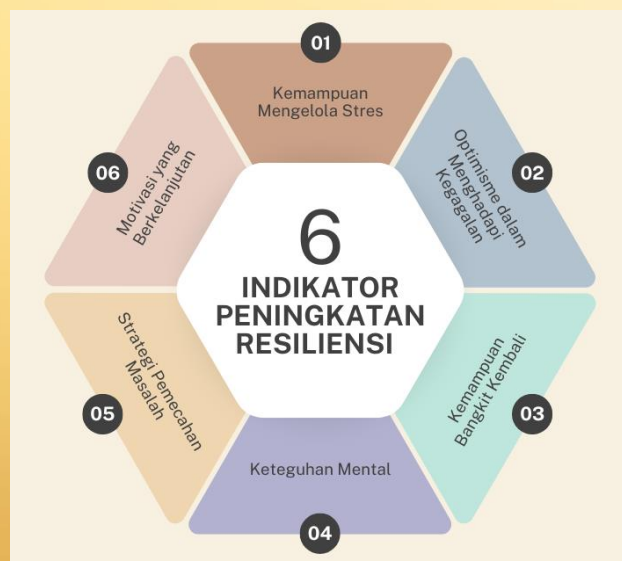
Gambar.2 indikator peningkatan resiliensi terhadap kegagalan akademik