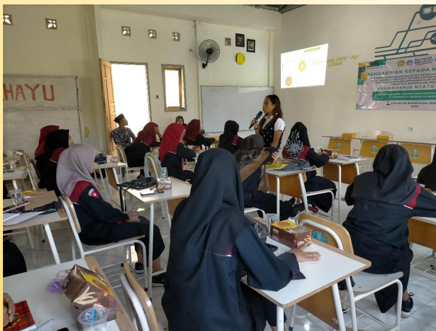
Gambar 4. Pelaksanaan Workshop/Pelatihan