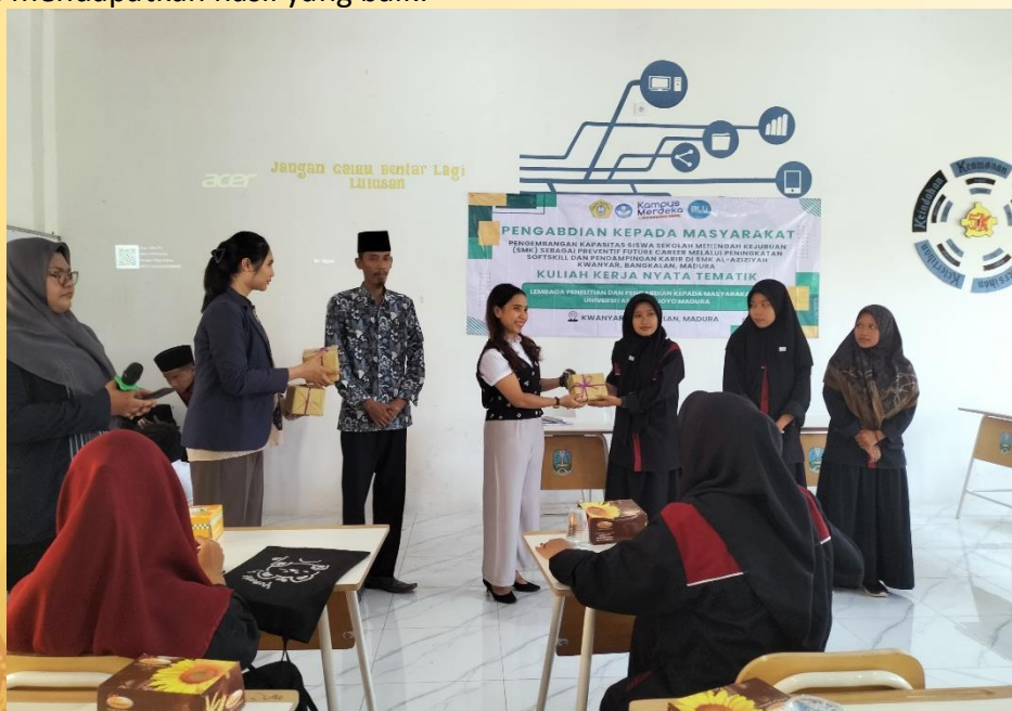
Gambar 6. Evaluasi dan Pemberian Hadiah

Evaluasi kegiatan ini kami laksanakan agar dapat mengetahui sejauh mana pemahaman siswa-siswi tentang komunikasi efektif. Cara yang kami lakukan agar mengetahui pemahaman siswa-siswi tentang materi yang disampaikan adalah dengan memberikan pre-test dan post-test. Sebelum workshop berlangsung, siswa-siswi diminta untuk mengisi pre-test. Setelah pelaksanaan kegiatan workshop siswa-siswi kembali diminta untuk mengisi soal post-test. Dan pemberian hadiah bagi peserta yang aktif dan mampu mendapatkan hasil yang baik.