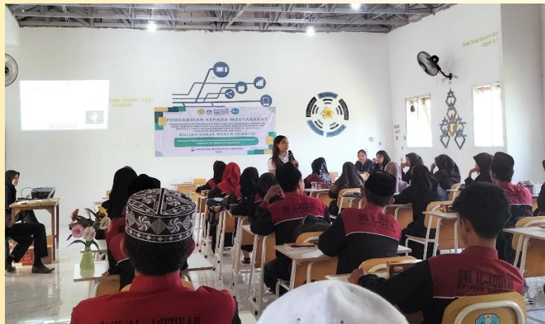
Gambar 3. Pelaksanaan Workshop/Pelatihan

untuk menggambar oleh pemateri tentang apa yang mereka dapatkan dalam kegiatan workshop tersebut, serta memberikan penjelasan tentang apa yang mereka gambar.