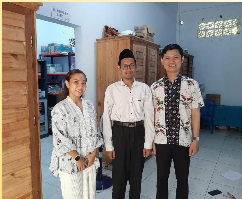
Gambar 2. Koordinasi dan Survey Bersama Kepala Sekolah