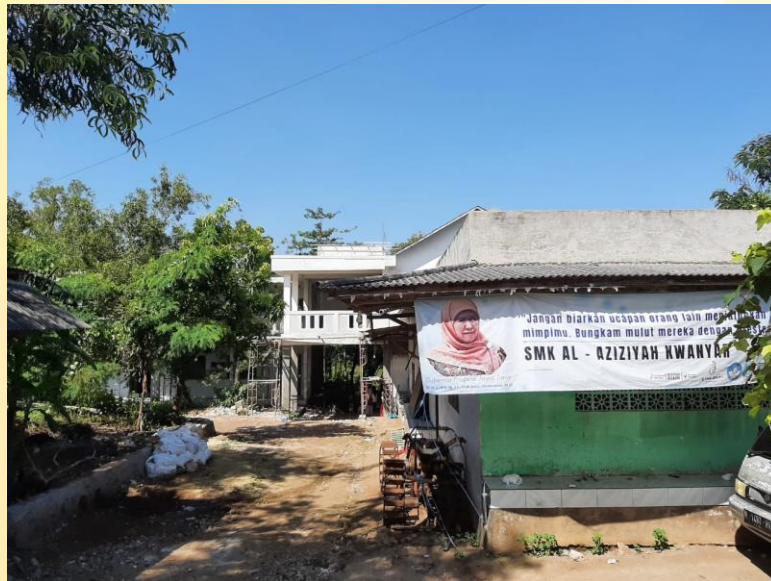
Gambar 1. Survey Awal Lokasi