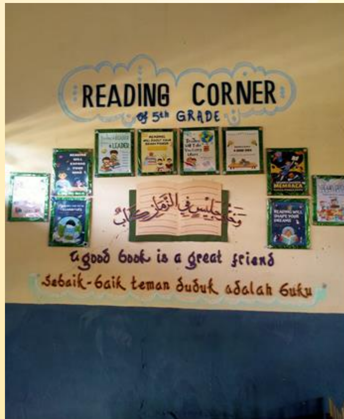
Gambar 4. Dekorasi Dinding