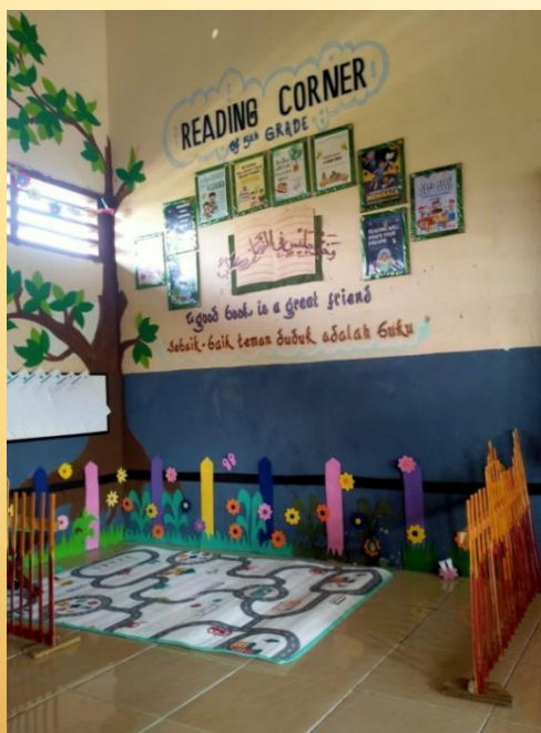
Gambar 1. Pojok baca di SDN Tenggulun

SDN Tenggulun terletak di Jl. Merdeka No. 01, TENGGULUN, Kec. Solokuro, Kab. Lamongan Prov. Jawa Timur. Merupakan sekolah yang cukup diminati oleh masyarakat. Adapun kelas yang ditunjuk untuk pembuatan pojok baca adalah semua kelas dari kelas 1 sampai kelas 6. Untuk Mengatasi kebosanan siswa dalam membaca, kepala sekolah mengadakan lomba menghias kelas agar guru masing-masing mendesain pojok baca semenarik mungkin, wali murid juga antusias ikut membantu menghias kelas. Beliau juga menyampaikan agar guru selalu mengganti buku dipojok baca melalui buku-buku yang ada diperpustakaan. Pojok baca di SDN Tenggulun didesain dengan semenarik mungkin untuk menumbuhkan minat baca.