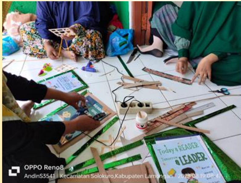
Gambar 3. Membuat Tulisan Kata-Kata Motivasi