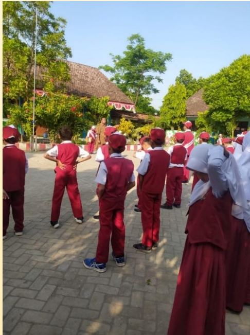
Gambar 2. Kegiatan Sosialisasi Lomba Menghias Kelas Sekaligus Pengenalan Pojok Baca

pojok baca pada khususnya. Sementara TIM pengabdian mencatat dan mendokumentasi kegiatan yang berlangsung.