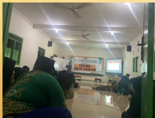
Gambar 2. Pemateri mengajak para peserta praktek menghitung haid dan istihadloh

Dari penjelasan diatas dapat dipahami bahwa darah yang keluar melebihi batas maksimal haid tidak serta merta dihukumi istihadloh semua atau yang dihukumi istihadloh adalah darah yang keluar melebihi batas maksimal saja, tetapi dilihat dari kondisi darah yang keluar memiliki sifat dan kekuatan yang mana.