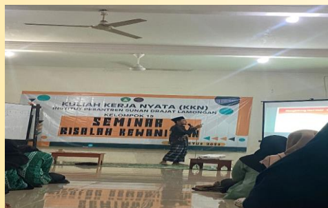
Gambar 1. Penyampaian materi seminar oleh pemateri

Jika ada wanita yang mengeluarkan darah tetapi tidak memenuhi 4 syarat diatas maka tidak dihukumi haid melainkan dihukumi istihadloh. Dari uraian diatas maka dapat dipahami masa haid paling sedikit dari seorang wanita adalah 1 hari, masa haid paling lama adalah 14 hari dan masa suci paling sedikit adalah 15 hari 15 malam.