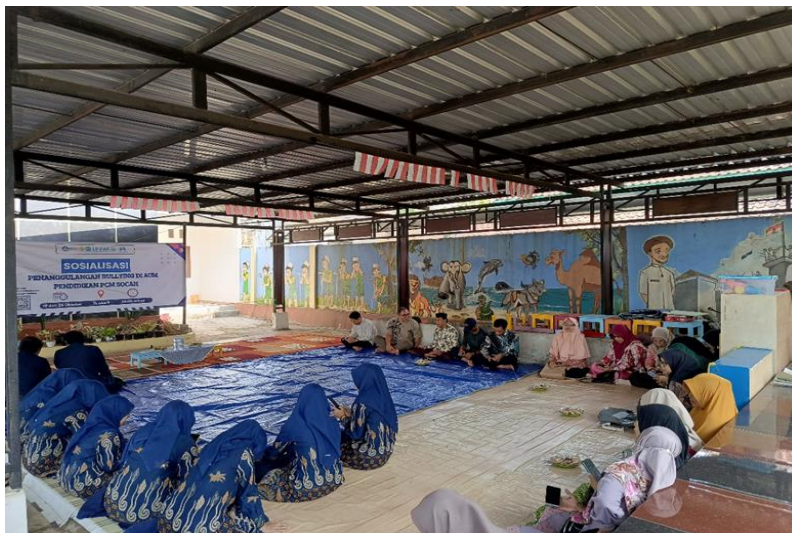
Gambar 3. Foto Kegiatan Sosialisasi Bullying Bagi Guru Muhammadiyah

Kegiatan diselenggarakan dalam bentuk sosialisai dengan materi “ Bullying menurut pandangan Islam” dan penjelasan tentang pengertian bullying , macam-macamnya dan dampaknya bagi siswa dengan tema “ No Bullying, No Toxic ”. Sebagaimana yang telah dijelaskan sebelumnya bahwa sosialisasi ini diperuntukkan bagi guru dan wali murid. Kegiatan sosialisasi tentang perilaku bullying di hadapan para guru diselenggarakan di TK ABA 9 Socah pada tanggal 19 Oktober 2024 dengan dihadiri oleh 28 tenaga pendidik AUM Pendidikan PCM Socah.