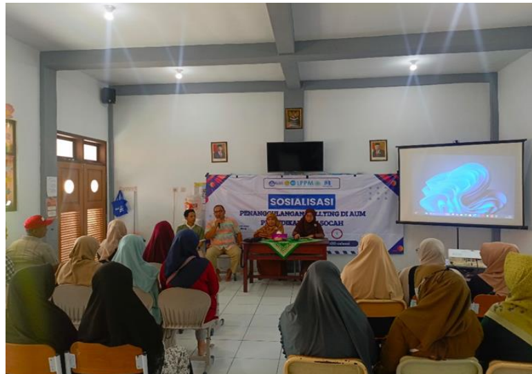
Gambar 4. Foto kegiatan sosialisasi bullying bagi wali murid

Kegiatan sosialisasi ini mendapatkan respon yang cukup positif di kalangan peserta, baik dari pihak guru dan sekolah. Harapannya, ke depan akan terjalin komunikasi yang lebih sehat dan kondusif antara pihak sekolah dan wali murid dalam memberikan layanan Pendidikan dan pengajaran kepada para siswa yang lebih baik lagi dan lebih humanis. Dengan demikian akan terbentuk generasi penerus bangsa yang cerdas dan sehat secara mental dan fisiknya. Sebab hal tersebut merupakan modal utama dalam menuju cita-cita Bersama, yaitu kebangkitan bangsa dan negara Indonesia.