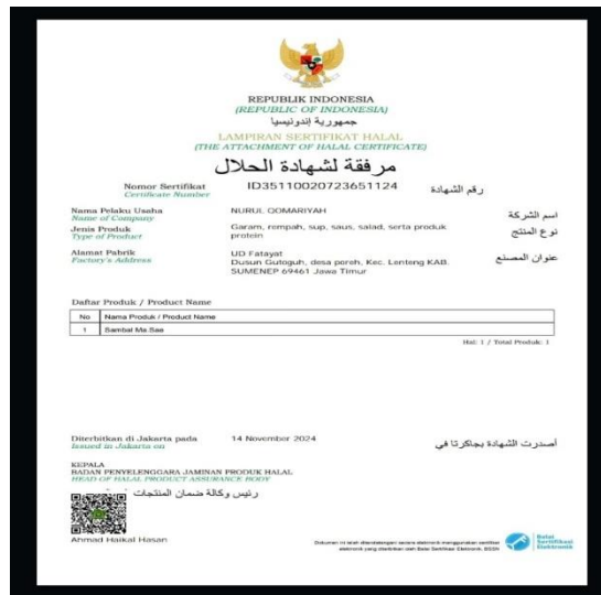
Gambar 7. Bukti Sertifikat Halal Sambal Ma Sae

Kegiatan pendampingan sertifikasi halal dan strategi digital marketing yang dilakukan kepada pelaku usaha di Desa Poreh memberikan dampak positif yang signifikan terhadap peningkatan pengetahuan dan perilaku mitra. Sebelum kegiatan, sebagian besar pelaku usaha belum memahami urgensi dan prosedur sertifikasi halal, namun setelah adanya sosialisasi dan pelatihan, mereka mulai menyadari bahwa sertifikat halal bukan hanya sekadar pemenuhan regulasi, tetapi juga menjadi instrumen penting untuk meningkatkan kepercayaan konsumen. Selain itu, pemahaman mitra mengenai pentingnya legalitas usaha melalui kepemilikan Nomor Induk Berusaha (NIB) juga meningkat. Mereka mulai termotivasi untuk mengurus NIB secara mandiri sebagai bagian dari proses sertifikasi halal dan sebagai bentuk legitimasi atas keberadaan usaha mereka.