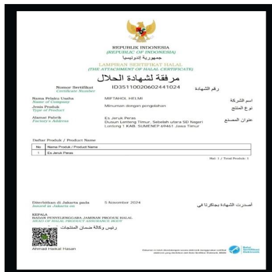
Gambar 7. Bukti Sertifikat Halal Es Jeruk Peras

Gambar 7. Proses Pendampingan Sertifikasi Halal Sambel Ma Sae Setelah diadakan pendampingan sertifikasi produk halal terhadap pelaku usaha, pada tanggal 5 November 2024 telah terbit sertifikat produk halal pelaku usaha pertama dengan nomor sertifikat ID35110020602441024 atas nama Bapak Miftahol Helmi dengan jenis produk berupa Es Jeruk Peras, dengan bukti sebagai berikut: