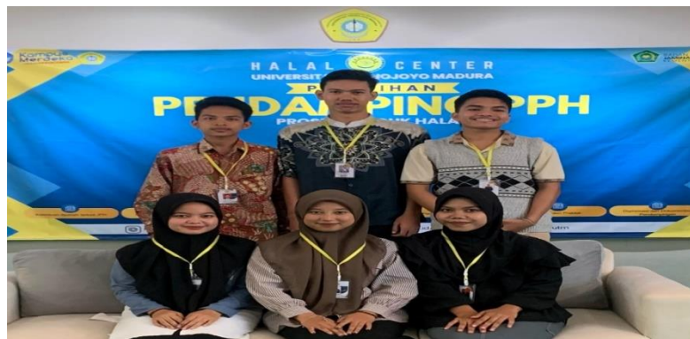
Gambar 2. Kegiatan Pelatihan menjadi Pendamping Proses Produk Halal

Kegiatan "Sosialisasi dan Pendampingan Sertifikasi Produk Halal Bagi Pelaku Usaha Mikro dan Kecil di Desa Poreh" telah dilaksanakan pada hari Rabu, 30 Oktober 2024 yang bertempat di Balai Desa Poreh, Kecamatan Lenteng, Kabupaten Sumenep. Proses yang dilakukan dalam pengabdian masyarakat saat ini adalah bersama para pendamping PPH dalam hal ini adalah para peserta mahasiswa MBKM KKNT dengan terus membantu sosialisasi terkait pentingnya sertifikasi produk halal yang ada di Desa Poreh. Beberapa pihak dalam kegiatan ini turut serta terlibat baik langsung maupun tidak langsung. Beberapa pihak tersebut antara lain Halal Center UTM sebagai konsultan para pendamping jika terdapat kendala, Pemerintah Desa Poreh sebagai mitra utama sehingga