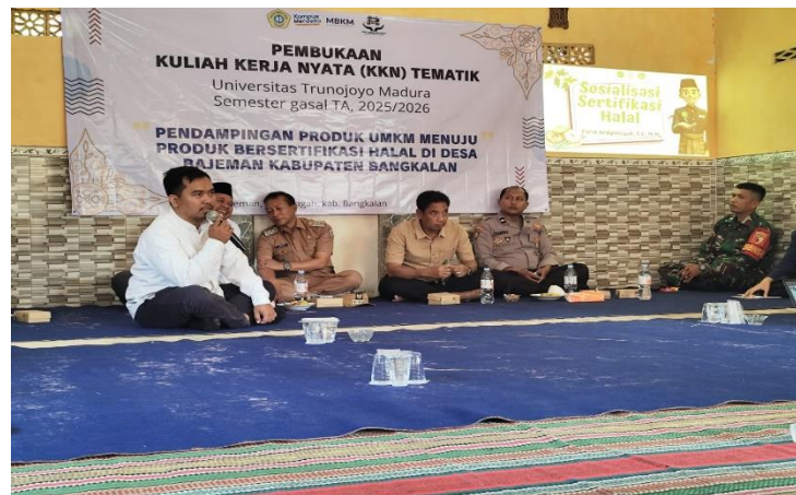
Gambar 1. Sosialisasi Pendampingan Produk Sertifikasi Halal

Kegiatan sosialisasi kesadaran Sertifikasi Halal ini dilakukan secara langsung pada hari Senin, 8 September 2025 dimulai pukul 08.00 WIB- 11.00 WIB yang disampaikan oleh Tim Halal Center Universitas Trunojoyo Madura. Dan para pelaku usaha mikro dan kecil sangat antusias dan memperhatikan baik proses sertifikasi halal dan dokumen-dokumen yang perlu disiapkan untuk mengajukan sertifikasi halal produk. Kegiatan ini diikuti oleh sejumlah 47 pelaku usaha yang ada di desa Bajeman Bangkalan.