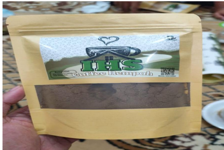
Gambar 4. Produk Unggulan Desa Bajeman yang menjadi Pilot Project Sertifikasi Halal

langsung oleh Petugas pendamping Produk Halal dari Halal Center Universitas Trunojoyo Madura.