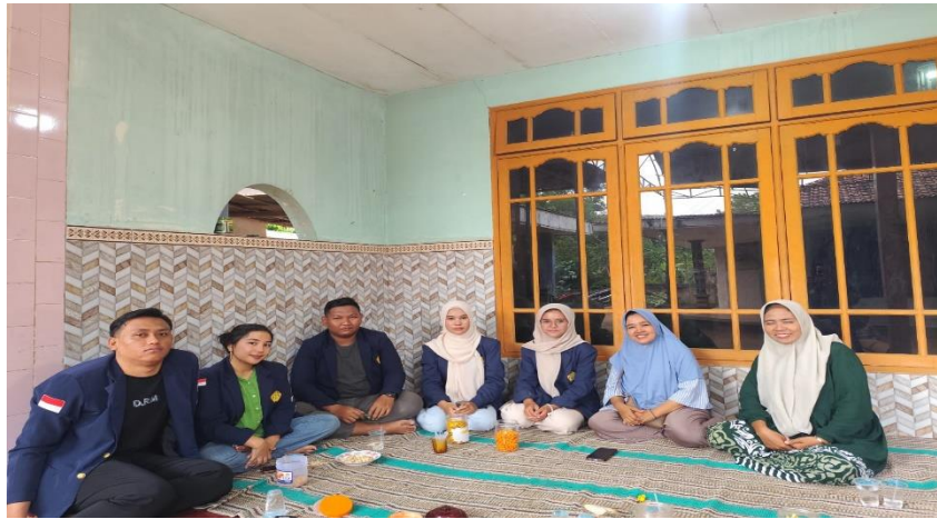
Gambar 2. Pendampingan Produk Sertifikasi Halal dengan Pelaku Usaha Mikro Kecil Desa Bajeman

komunikator, motivator dan verifikator dan validator karena sudah memiliki sertifikat dan nomor register dari BPJPH lewat lembaga pendamping yang menjadi bagian dari Halal Center Universitas Trunojoyo Madura.