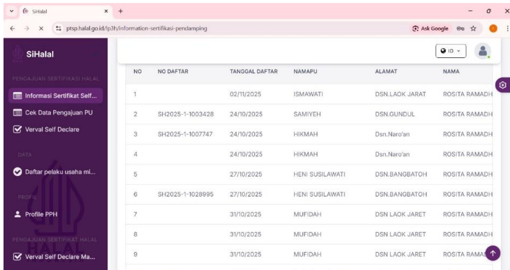
Gambar 2. Tampilan progres pengajuan sertifikasi halal di akun resmi BPJPH