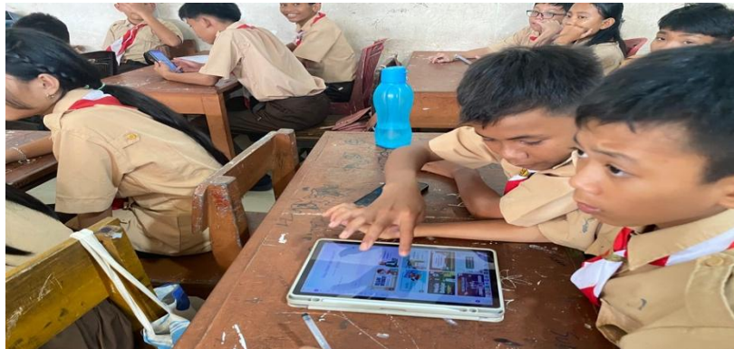
Gambar 5. Peserta membuat video animasi

Peserta sudah disampaikan untuk membawa laptop atau smartphone, akan tetapi ternyata semua peserta membawa smartphone saja. Hal ini menjadi salah satu kendala dalam pelaksanaan kegiatan ini. Tetapi beruntungnya canva bisa didesain dengan memanfaatkan smartphone, sehingga peserta tetap dapat mengikuti pelatihan dengan lancar. Peserta diajari mulai dari pengenalan media canva sampai cara desain video animasi dengan trik yang mudah dipahami. Peserta dibagi berkelompok secara heterogen yaitu berbeda suku, jenis kelamin, warna kulit. Hal ini bertujuan untuk menguatkan nilai-nilai toleransi melalui kerjasama dalam pembuatan video animasi dengan tema toleransi.