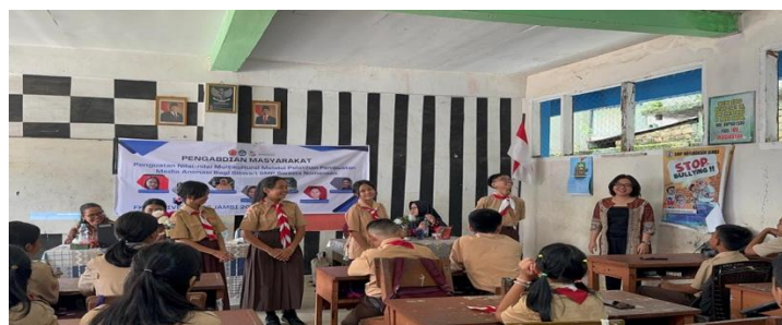
Gambar 3. Penyampaian materi Nilai-nilai Multikultural

Nilai-nilai yang sudah dimuat dalam pembelajaran, perlu diaplikasikan dalam kehidupan sehari-hari. Wujud nyata dari implementasi nilai-nilai multikural yaitu sikap saling menghargai perbedaan, menjunjung tinggi sikap toleransi, menghindari konflik yang dipicu oleh pertentangan suku, agama dan ras.