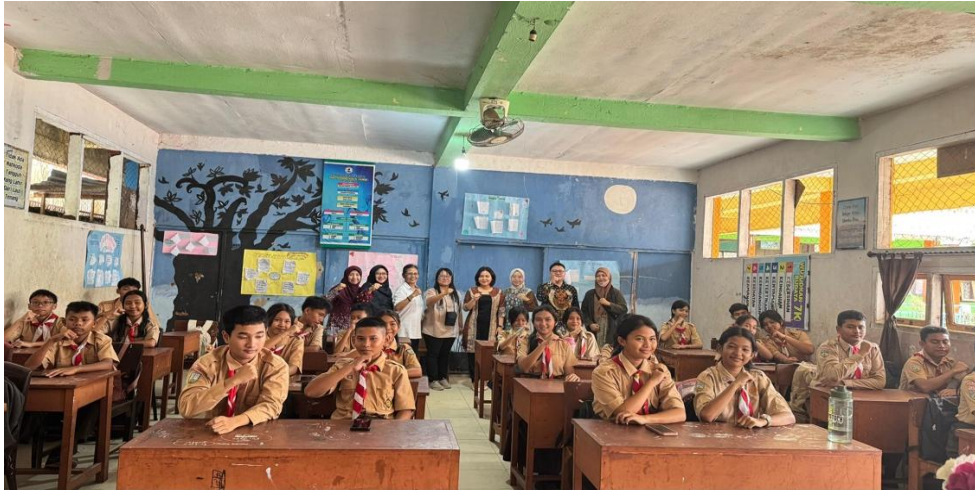
Gambar 6. Foto bersama seluruh peserta setelah kegiatan Refleksi dan Evaluasi

Walau pelatihan singkat, tetapi peserta masih mendapatkan pendampingan dalam penerapan hasil pelatihan di lapangan. Tim pengabdian masih mendampingi dari proses pemilihan materi, desain, sampai peserta sudah mampu membuat video animasi yang mereka inginkan. Peserta berhasil membuat video animasi sejumlah 25 orang, sedangkan 5 orang lainnya mengalami kendala dikarenakan Ipad/ Handphone yang mereka gunakan kurang mendukung dalam penggunaan aplikasi canva. Kelanjutan pendampingan ini merupakan dukungan penuh tim kepada peserta untuk mewujudkan tujuan kegiatan pengabdian ini yaitu penguatan nilai-nilai multikultural melalui pembuatan video, juga sebagai bentuk tanggungjawab dan kepedulian untuk meningkatkan kualitas pendidikan di Indonesia, dan tujuan lainnya adalah agar kegiatan ini memiliki dampak dan manfaat nyata yang berlanjut dimasa yang akan datang.