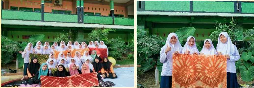
Gambar 3. Pendampingan Pembuatan Batik Ikat Siswa MTs Sunan Drajat