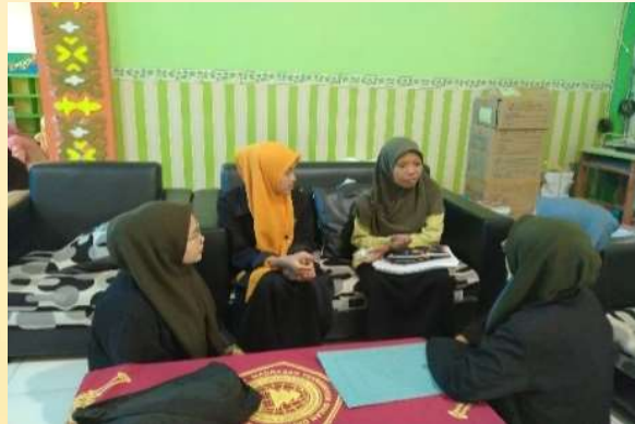
Gambar 2. Menawarkan Dan Merancang Program Pendampingan

Drajat Banjarwati Paciran Lamongan diantaranya yaitu, rebana, seni musik, tari tradisional dan tari modern, keterampilan hasta karya , tata boga, serta lembaga pers siswa. Kegiatan ekstrakurikuler untuk pengembangan budaya dan ketrampilan. Dari kegiatan ekstrakurikuler hasta karya yang diikuti tersebut diharapkan dapat menjadi pesangon keterampilan bagi siswa ketika telah terjun di masyarakat. 19 Dalam penawaran dan perancangan kegiatan pendampingan yang akan dilaksanakan, sehingga berjalan sukses serta membuahkan hasil yang maksimal.