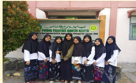
Gambar 3. Dokumentasi pelatihan kedua bersama para santri