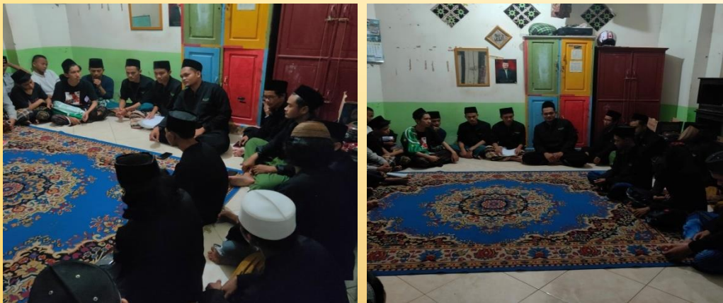
Gambar 1: Proses Pengenalan dan penjelasan tentang pembelajaran kitab nahwu (Al jurrumiyah)

Pada minggu pertama, diisi dengan pengenalan mahasiswa KKN, dan pengenalan santri al fikr, penetapan jadwal pendampingan, dan kami langsung memulai pengajian kitab jurmiah mulai dari bab pertama yaitu bab kalam disitu kami menerangkan secara jelas dan dipahami para santri.