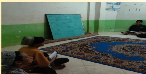
Gambar 4. Majelis Al-fikr dalam praktek nahwu

Kegiatan minggu ketiga ini kami isi dengan pengajian dan praktek bagi siswa santri sunan bonang mulai dari menulis contohnya kalimat isim, kalimat fiil, dan kalimat huruf di papan tulis santri maju satu-persatu ke depan.