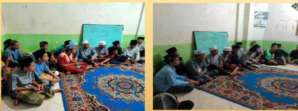
Gambar 3 : Majelis Al-Fikr Dalam Kegiatan Diskusi

Pada minggu kedua kami mengisinya dengan diskusi rutin seperti biasanya kegiatan majlis al fikr yang sudah berjalan yaitu kegiatan diskusi rutin dengan tema Aswaja. Disitu kami menjelaskan bagaimana perjalanan kepehaman tentang agama islam setelah meninggalnya Nabi Muhammad, mulai dari kholifah sayyidina abu bakar, sayyidina umar, sayyidina ustman, sayyidina Ali sampai pada ke masa pemikirannya pelopor dengan nama aswaja yaitu abu musa asy'ari al maturidi setelah sekian lama kami berdialog atau yg dikenal dengan diskusi kami memberi waktu kepada santri supaya menyampaikan apa yang ditanyakan terkait pembahasan yang telah kami sampaikan.