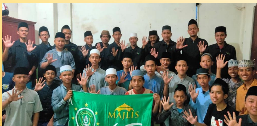
Gambar 5. Majelis Al-fikr bersama Pendamping acara Diskusi

Tahapan terakhir yaitu melakukan evaluasi, Evaluasi ini bertujuan untuk mengetahui tingkat keberhasilan para santri Al-Fikr dalam pembelajaran Aswaja dan Nahwu. Evaluasi dilakukan dengan pemberian latihan soal yang berkaitan dengan Aswaja dan juga pembelajaran nahwu. Adapun hasil evaluasi yang telah di dapatkan bisa disimpulkan bahwa 20 dari 30 santri yang mengikuti pendampingan sudah mendapatkan nilai baik dengan kata lain mereka sebagian besar telah memahami apa yang telah di sampaikan oleh tim pelaksana berkaitan materi aswaja dan nahwu. Hal ini juga bisa dilihat pada waktu acara diskusi bersama, beberapa santri mengajukan pertanyaan sederhana mengenai pembelajaran aswaja dan terjadilah diskusi yang baik antar santri di asrama sunan boning. Berikut salah satu gambar setelah kegiatan berakhir: