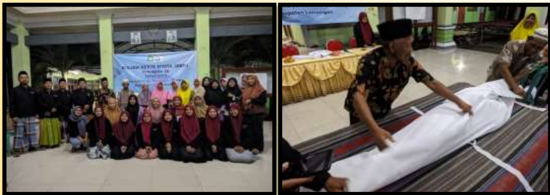
Gambar 1. Dokumentasi pelatihan mengurus jenazah

Sesuai dengan program pelatihan merawat jenazah yang di adakan oleh mahasiswa KKN Institut Sunan Drajat kepada pemuda desa sidomulyo, hasilnya dapat di rasakan oleh pemuda sidomulyo. Adapun indikator keberhasilan pelatihan merawat jenazah ini dapat dilihat pada tabel di bawah ini :