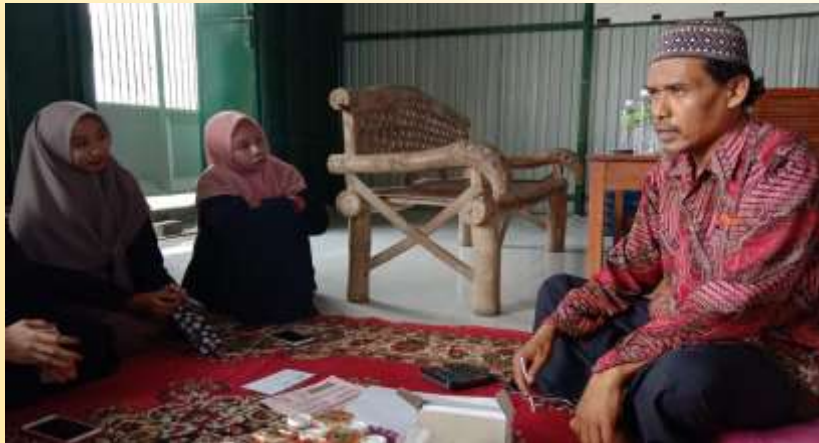
Gambar 1. sosialisasi tentang manfaat dan fungsi