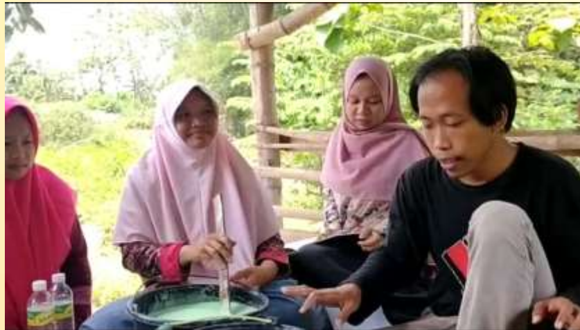
Gambar 2. Pembuatan sabun cuci piring