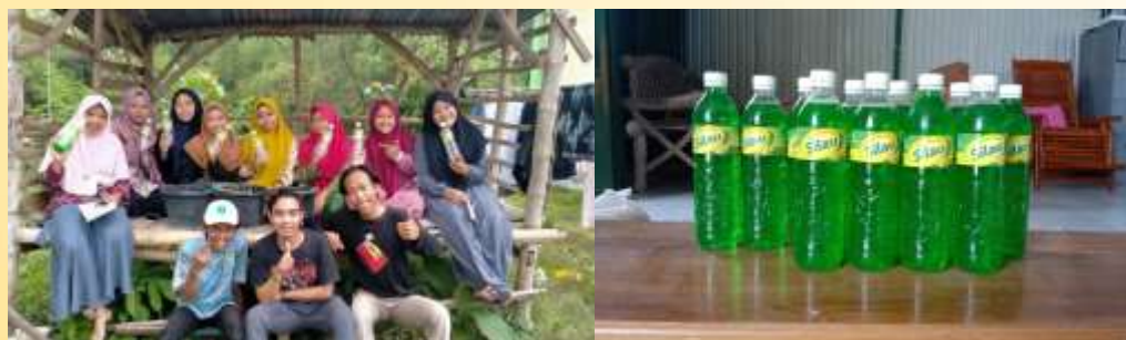
Gambar 3. Pengemasan produk sabun cuci piring