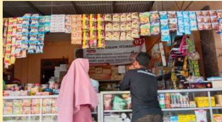
Gambar 5. Pemasaran produk ke cabang toko MBS

Pada tahap pemasaran ini dibagi dua cara : 1. Cara manual, memasarkan produk dengan cara mensosialisasikan produk melalui anggota dari beberapa cabang toko Makmur Bersama (MBS) pada saat pengiriman barang sekaligus pada saat event minggu wage yang dilaksanakan sebulan sekali, yang dihadiri seluruh anggota investor Makmur Bersama. 2. Cara digital marketing, yaitu strategi pemasaran online yang memanfaatkan perangkat mobile seperti smartphone untuk dijadikan sebagai sarana prasarana dalam memasarkan sebuah produk bisa melalui whatsapp, instagram, facebook dan lain-lain . 4