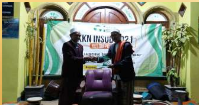
Gambar 4. Peresmian produk sabun cuci piring "silau"

Pada tahap ini kelompok ekonomi meresmikan produk sabun cuci piring bermerek (SILAU) yang telah dibuat. launching produk dilakukan bersamaan dengan penutupan KKN INSUD kelompok 12, yang diresmikan oleh pengasuh dan disaksikan oleh seluruh santri dan karyawan. Acara peresmian didukung penuh oleh semua pihak dan diharapkan bisa berkembang secara cepat.