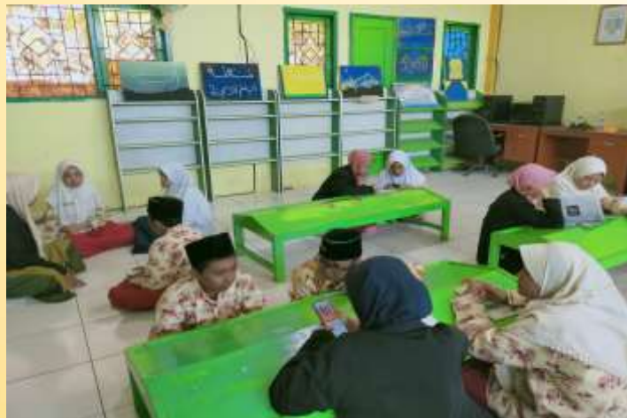
Gambar 5. Kegiatan Pemetaan Aset

Secara terinci metode dalam pendampingan meliputi: Tahap Discovery yang mengungkapkan hasil pemetaan potensi atau aset yang dimiliki oleh peserta didik dengan mengaitkan potensi lembaga yang pernah dicapai sebelumnya terkait dengan pembuatan Majalah "JIWA" yang telah vacum selama 7 tahun dan kini akan kita daya gunakan aset ini sebagai gagasan kreatif yang akan kita munculkan kembali. Selain itu, pada tahap ini pula kami melakukan sosialisasi program kerja serta penyampaian visi misi yang akan kami wujudkan bersama dalam satu komunitas.