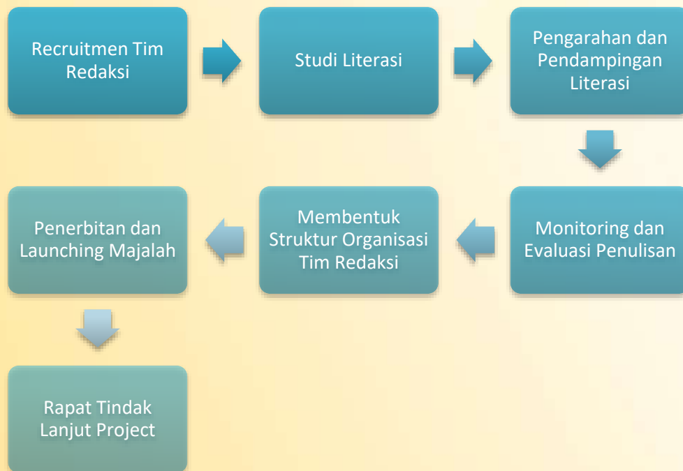
Gambar 8. Diagram alur program kerja pendampingan

Selain itu pada Tahap Design , kami mulai merumuskan program kerja berupa strategi, proses dan sistem dalam mengembangkan kolaborasi dan pendampingan yang mendukung terwujudnya visi dan misi yang diharapkan. Pada tahap perumusan program kerja ini, semua hal positif di masa lalu ditransformasi menjadi kekuatan untuk mewujudkan perubahan yang diharapkan. Adapun program kerja yang kami rumuskan adalah: