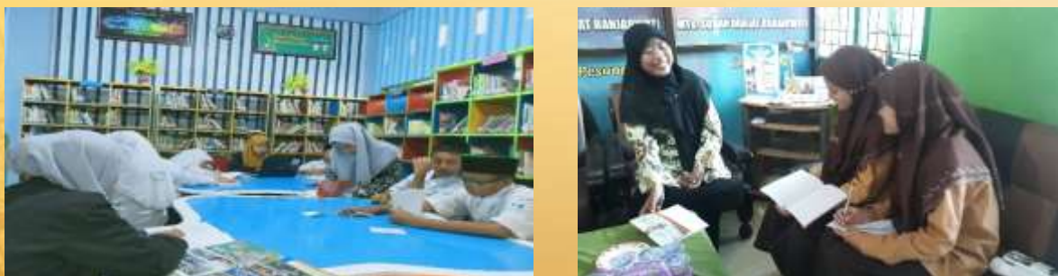
Gambar 9. Pendampingan Tim Redaksi dalam pembuatan majalah

Tahap Define yakni mendukung keterlaksanaan program kerja melalui pendampingan Studi Literasi yang nantinya akan diimplementasikan dalam penulisan rubrik majalah JIWA edisi ke-2. Pada kegiatan Studi Literasi ini kami memberikan pengarahan (mulai dari memberi pemahaman tentang definisi setiap rubrik hingga cara penulisannya) kepada tim redaksi sesuai dengan pemetaan aset siswa melalui rubrik yang akan diterbitkan. Dalam tahap Define ini pula kami bersama dengan anggota berhasil menyelesaikan seluruh isi rubrik melalui tahap evaluasi dan monitoring hasil penulisan sesuai dengan pembagian potensi dan aset masing-masing anggota tim redaksi.