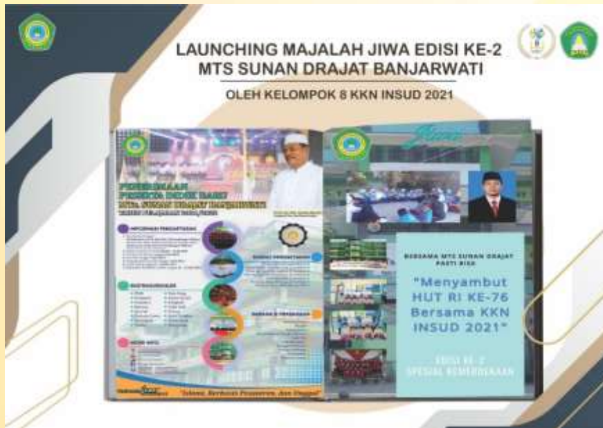
Gambar 9. Launching Majalah JIWA edisi ke-2