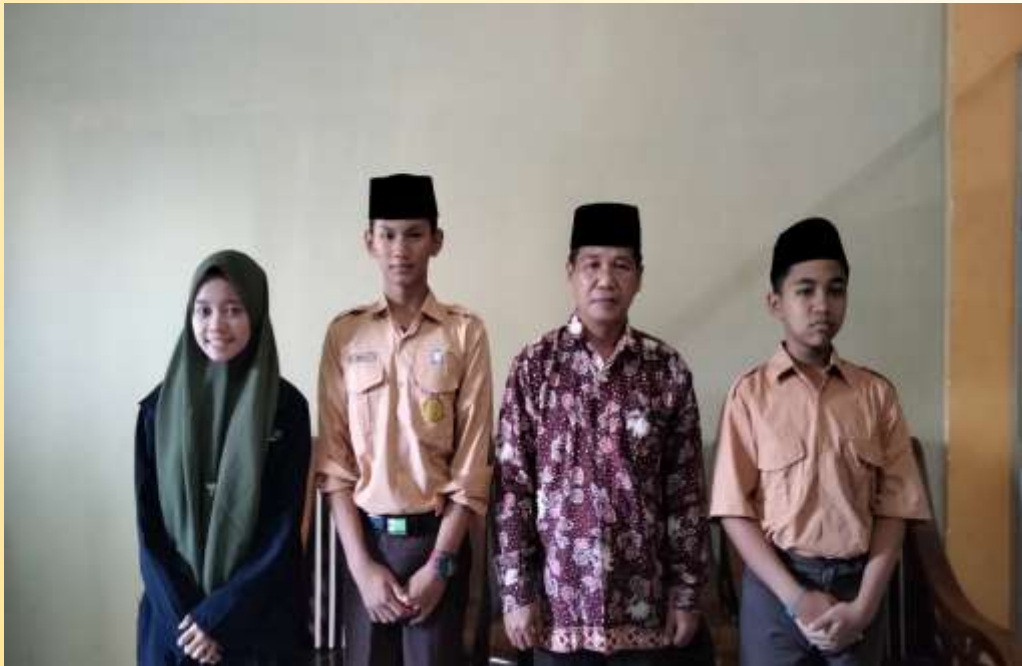
Gambar 7. Kegiatan Sosialisasi Aset pada pihak lembaga

Tahap Design , pada tahap ini tujuan penggolongan dan mobilisasi aset adalah untuk langsung membentuk jalan menuju pencapaian visi atau gambaran masa depan. Setelah diidentifikasi, sudah selayaknya pihak lembaga mendapatkan informasi mengenai aset yang dimiliki. Untuk itu, kegiatan sosialisasi aset kepada pihak lembaga menjadi sebuah langkah yang diharapkan dapat membangun prinsip Kemitraan ( Partnership ). Partnership merupakan salah satu prinsip utama dalam pendekatan pengembangan masyarakat berbasis aset ( Asset Based Community Development ). Prinsip transparansi informasi mengenai aset lembaga tersebut dipupuk dengan komunikasi yang intensif dengan pihak pimpinan lembaga.