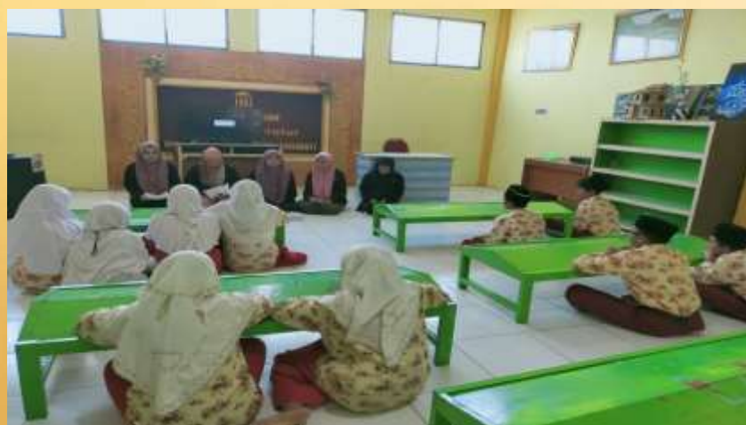
Gambar 6. Sosialisasi Program Kerja