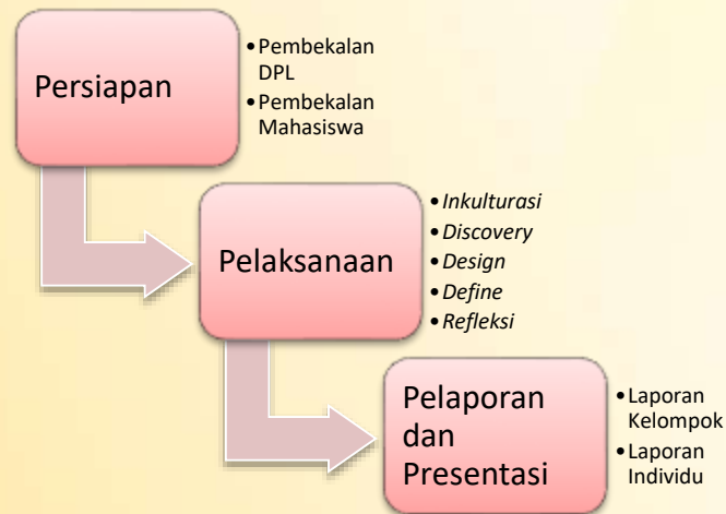
Gambar 2. Gambaran Umum Pelaksanaan KKN ABCD

Tahapan kegiatan KKN ABCD meliputi tiga Tahapan besar, yakni Tahap Persiapan, Tahap Pelaksanaan, Tahap Pelaporan dan Presentasi Hasil KKN. Adapun kegiatannya seperti di bawah ini: