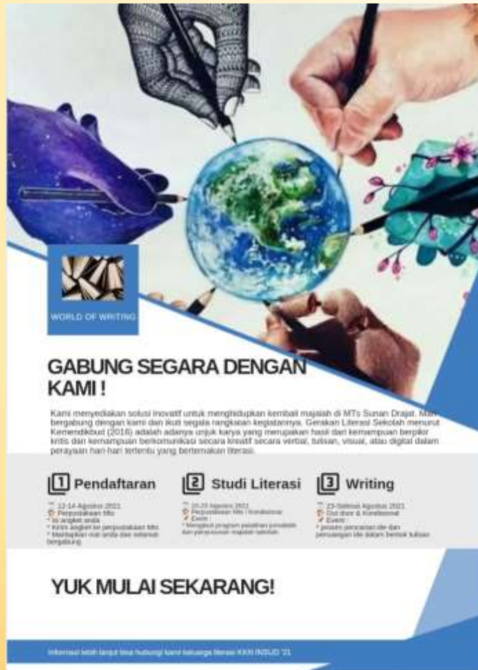
Gambar 4. Pamflet perekrutan komunitas tim redaksi

Kegiatan silaturahmi kepada pihak lembaga yang dikembangkan dalam mengungkapkan impian-impian yang diharapkan dimasa yang akan datang. Secara sederhana dalam pendampingan dengan metode ABCD dimulai dari Community Map melalui proses Open Recruitment dan penyebaran angket minat penulisan jurnalistik terhadap peserta didik. Melalui angket tersebut kita menginventaris aset yang dimiliki oleh peserta didik sehingga dapat diketahui potensi yang akan dikembangkan. Adapun hasil dari Community Map dapat kita wujudkan dalam Pembagian Rubrik majalah, yakni sebagai berikut: