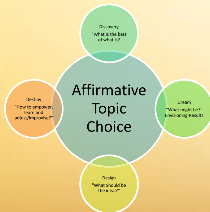
Gambar 1. Siklus dan Tahapan Pengelolaan Perubahan Berdasarkan 4-D

Menemukenali dan memobilisasi aset ini meliputi beberapa langkah, yang pertama adalah Penemuan Apresiatif ( Appreciative Inquiry ), adalah cara yang positif untuk melakukan perubahan organisasi berdasarkan asumsi yang sederhana yaitu bahwa setiap organisasi memiliki sesuatu yang dapat bekerja dengan baik, sesuatu yang menjadikan organisasi hidup, efektif dan berhasil, serta menghubungkan organisasi tersebut dengan komunitas dan stakeholdernya dengan cara yang sehat. Proses ini terdiri 4 tahap yaitu Discovery, Dream, Design, dan Destiny atau sering disebut model atau siklus 4-D. 1) Discovery , adalah proses pencarian yang mendalam tentang hal-hal positif, hal-hal terbaik yang pernah dicapai dan pengalaman-pengalaman keberhasilan dimasa lalu. 2) Dream , adalah setiap orang mengeksplorasi harapan dan impian mereka baik untuk diri mereka sendiri maupun untuk organisasi. 3) Design , adalah orang mulai merumuskan strategi, proses dan sistem, membuat keputusan dan pengembangan kolaborasi yang mendukung terwujudnya perubahan yang diharapkan. 4) Destiny adalah tahap dimana setiap orang dalam organisasi mengimplementasikan berbagai hal yang suka dirumuskan pada tahap design . 3