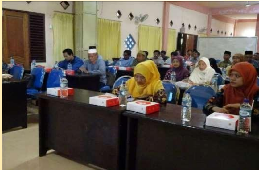
Gambar 3. Sosialisasi dan koordinasi program dengan pihak-pihak terkait

Gambar 3 adalah sosialisasi dan kordinasi program dengan pihak-pihak terkait. Sosiaslisasi ini berfungsi untuk dapat menyamakan persepsi seluruh pihak terkait akan manfaat dan kegunaan riset. Dalam sosialisasi ini juga disampaikan tentang hasil observasi awal yang telah di inventaris peneliti dan rencana kerja peneliti dalam pendampingan yang akan dilakukan. Pemaparan yang dilakukan juga untuk menyampaikan tentang rencana pembentukan kelompok-kelompok pendukung riset.