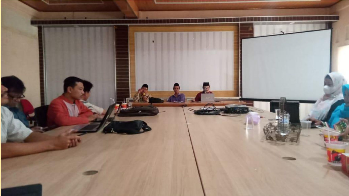
Gambar 2. Observasi dan Pemantaban Program

Gambar 2 adalah observasi dan pemantaban program. Pemantaban program dilaksanakan untuk memastikan kesiapan pelaksanaan pendampingan yang akan dilakukan. Pemantaban dilaksanakan bersama mitra Institut Pesantren Sunan Drajat.