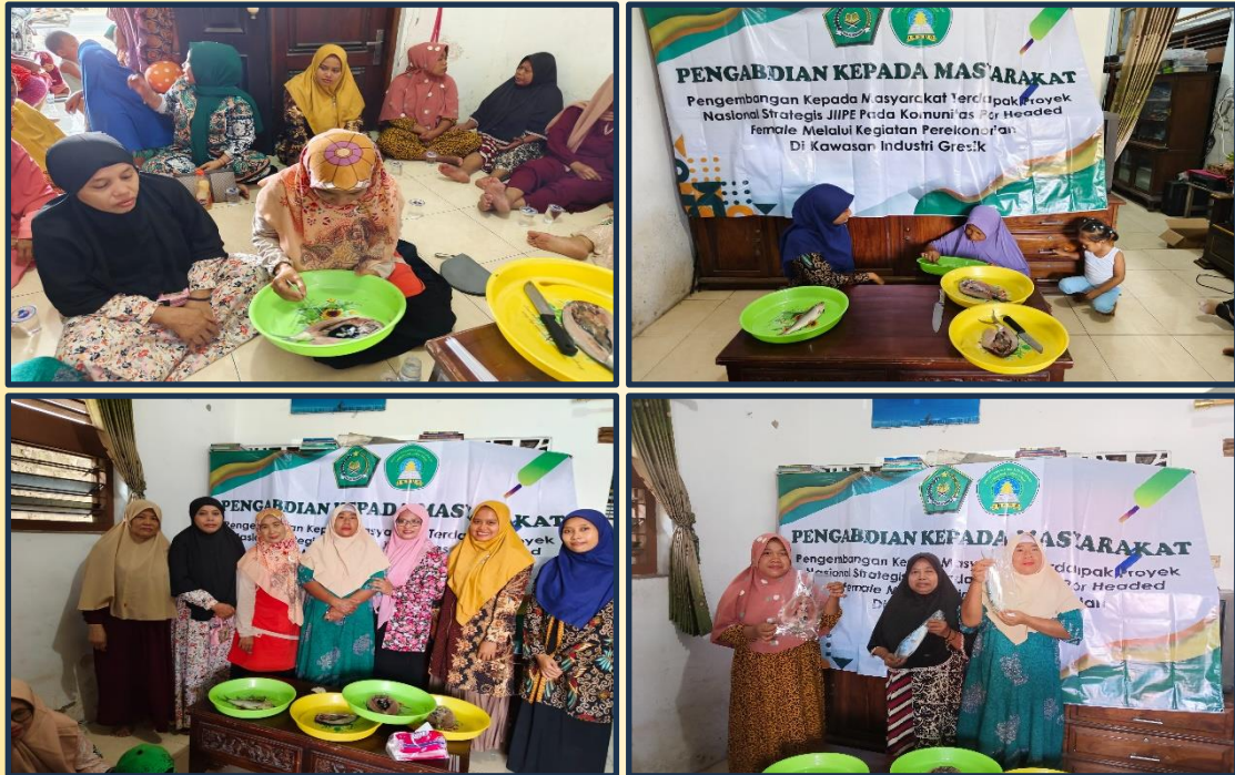
Gambar 2. Pendampingan Pengolahan Bandeng Cabut Duri Oleh Tim Batari Kepada poor headed female (kepala keluarga perempuan miskin) di kawasan industri gresik Selain itu juga selama pelatihan terlihat serius menerima materi dan praktek langsung.

Berdasarkan informasi yang kami terima dari hasil observasi atau survei menunjukkan, bahwa Desa karangrejo memiliki potensi hasil panen ikan dari kegiatan budidaya system polykultur cukup besar, sehingga bahan baku yang digunakan bisa lebih murah, segar dan mudah di dapatkan. Lokasi tambak sangat dekat dengan pemukiman penduduk sehingga memudahkan dalam mendapatkan bahan baku bandeng segar (Patra, 2017). Dengan potensi tersebut Ibu – ibu poor headed female (kepala keluarga perempuan miskin) di kawasan industri gresik akan sangat mudah memulai bisnis tersebut., tinggal kemauan dan keseriusan dan kapan memulai menggeluti bisnis tersebut untuk dikembangkan dan menjadi salah satu mata pencarian tambahan, bahkan bisnis utama didusun tersebut.