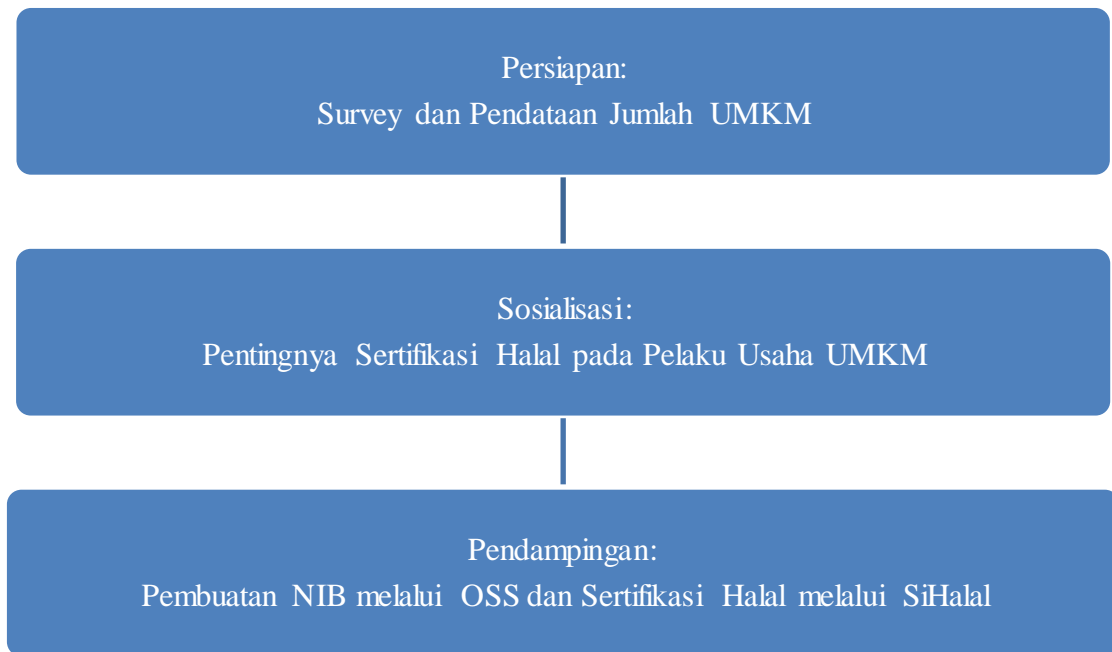
Gambar 1. Tahap Pengabdian Masyarakat

Kegiatan pengabdian dibagi menjadi tiga tahap, yaitu :