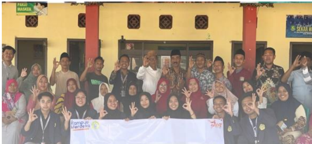
Gambar 2. Pelaksanaan Sosialisasi Program Sertifikasi Halal dan NIB

Sesi diskusi dan tanya jawab dalam kegiatan sosialisasi memberikan kesempatan bagi para pelaku UMKM untuk bertanya secara langsung, memperjelas poin-poin yang belum dimengerti sepenuhnya. Diskusi ini menciptakan kesempatan untuk menjelaskan lebih lanjut mengenai prosedur-prosedur terkait sertifikasi halal dan NIB. Penekanan juga diberikan pada pentingnya aspek legalitas ini dalam pengembangan usaha mereka, serta bagaimana setiap langkah dalam proses ini untuk kelangsungan usaha UMKM di Sumenep. Oleh sebab itu, sosialisasi ini tidak hanya menjadi sebuah kesempatan untuk mendapatkan informasi, melainkan juga peluang bagi para pelaku UMKM untuk memperoleh pemahaman yang lebih mendalam mengenai urgensi legalitas dalam pengelolaan usaha mereka.