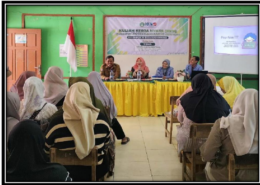
Pelaksanaan Seminar Parenting

Dalam pelaksanaan seminar parenting ini ada 3 sesi, yaitu pemaparan materi, ice breaking , dan tanya jawab. Untuk pemaparan materi memerlukan waktu selama 30 menit, ice breaking 15 menit, dan tanya jawab selama 15 menit.