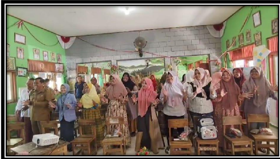
Gambar 4. Kegiatan ice breaking