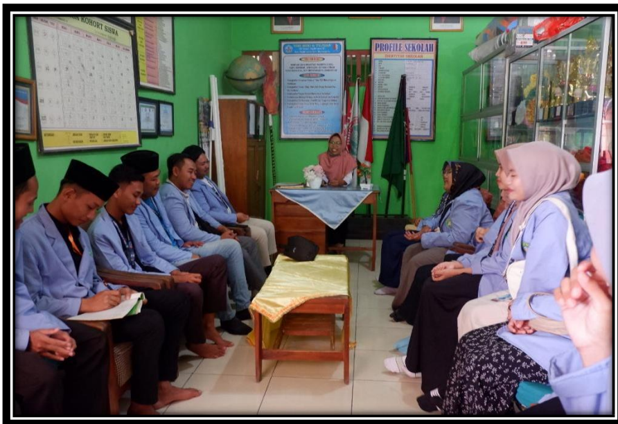
Gambar 1. Tim Panitia Pelaksana Seminar Parenting (kelompok 10 KKN INSUD) Diskusi dengan lembaga

Adapun sebelum program tersebut dilaksanakan, Tim panitia pelaksana seminar parenting melakukan diskusi terkait pelaksanaan program dengan pihak berwenang yakni lembaga dan juga perwakilan dari walimurid SD Negeri 3 Sugihwaras dengan hasil yang didapatkan adalah seminar parenting di khususkan untuk pendampingan orangtua anak kelas 1-6 yang mana usia mereka merupakan usia-usia emas dalam kehidupan mereka. Dengan adanya pendampingan ini, walimurid diharapkan dapat mengontrol anak-anak mereka dengan baik.