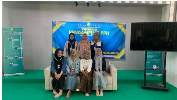
Gambar 1. Pelatihan sertifikasi halal di halal center Utm

Persiapan sangat penting untuk menjamin makanan olahan mematuhi standar sertifikasi halal. Persiapan sangat penting bagi fasilitator, karena mereka harus memahami prinsip dan hukum yang mengatur barang halal, termasuk pemahaman tentang makanan, minuman, dan komponen yang dianggap halal atau haram menurut ajaran Islam.