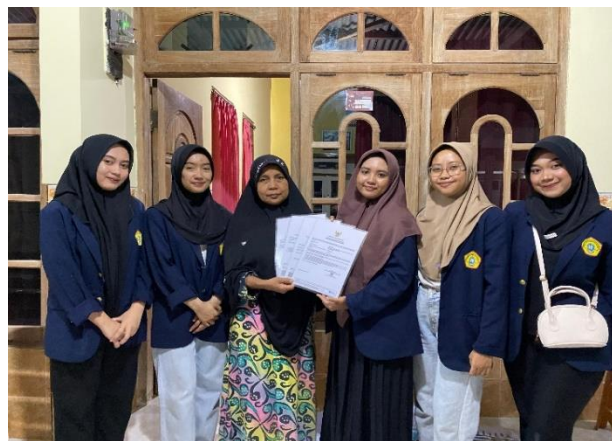
Gambar 5. Penyerahan sertifikat halal

Setelah sertifikat halal diberikan pendamping tetap melakukan pemantaun rutin sebagai pengawasan agar pelaku usaha tetap mematuhi standar halal yang telah di tetapkan. Ini termasuk memastikan tidak ada perubahan dalam bahan atau proses yang dapat memengaruhi status kehalalan produk. Melalui siklus pemantaun ini, pendamping dapat membantu pelaku usaha untuk mematuhi prosedur sertifikasi halal, menhajaga kualitas produk, dan memenuhi standart halal sesuai aturan yang berlaku