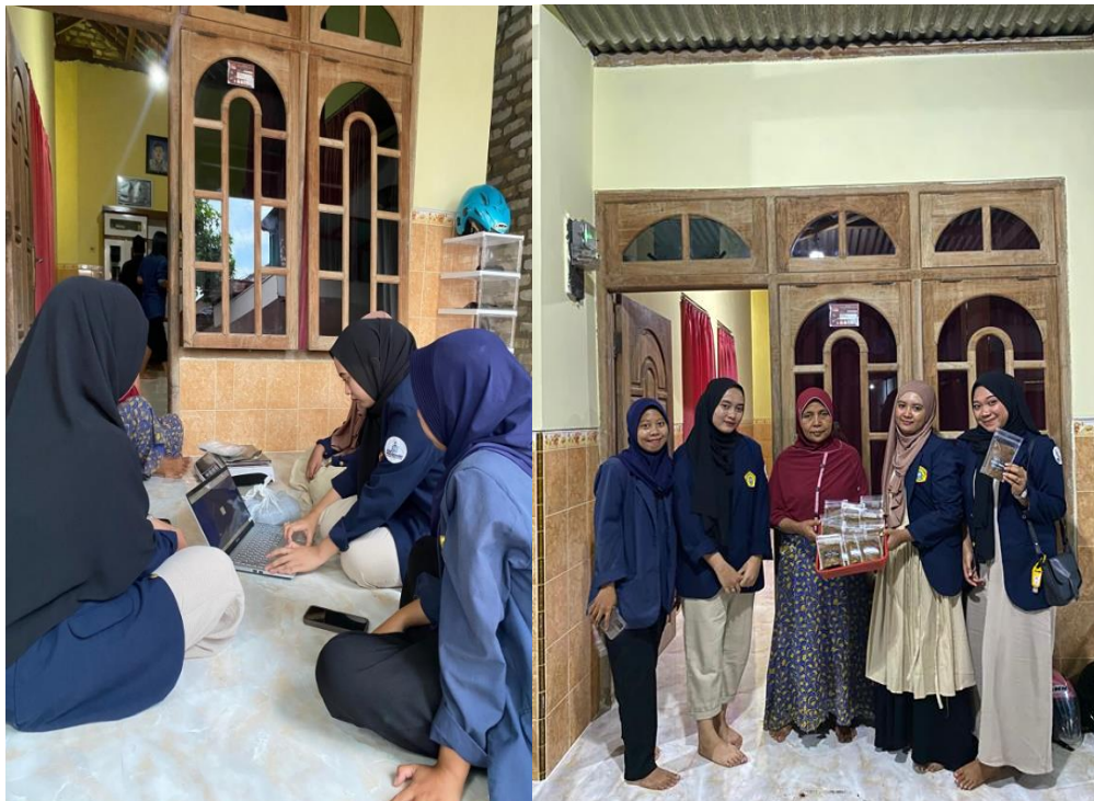
Gambar 3. Pendampingan sertifikasi halal