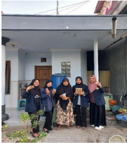
Gambar 2. Survey Umkm

Kegiatan Survei yang dilaksanakan kepada pelaku usaha diawali dari pencarian data dan dokumen pendukung yang didapatkan dari BUMDES. Penting untuk melakukan kegiatan operasional, yaitu survei lapangan, dan berkoordinasi dengan BUMDES untuk mengumpulkan informasi tentang badan usaha di Desa Panempen. Pengaturan administratif untuk pemangku kepentingan perusahaan dilakukan dari 10 Oktober - 12 Oktober 2024. Operasi ini memerlukan pengumpulan data tentang semua UMKM, termasuk identifikasi pemangku kepentingan dan karakteristik unit usaha mereka.