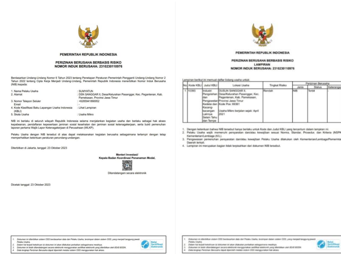
Gambar 9. NIB dan KBLI pendampingan proses produk halal

Setelah UMK binaan memiliki NIB, proses selanjutnya adalah pembuatan akun website SIHALAL dengan menggunakan email yang sama dengan akun pada website OSS. Pendamping PPH memfasilitasi kelengkapan pengisian dokumen Sistem Jaminan Halal self declare untuk selanjutnya diunggah ke SIHALAL. Untuk keperluan pendaftaran sertifikasi halal self declare , digunakan kode fasilitasi SEHATI yang diterbitkan oleh BPJPH. Secara umum, pengajuan sertifikasi halal self declare lebih mudah dari pada pengajuan sertifikasi halal reguler (Jamil and Ariswanto 2025). Hal ini dikarenakan penggunaan bahan baku yang dipastikan kehalalannya dan proses produksi yang sederhana. Pada menu ini, pelaku usaha mendaftar akun dengan memilih type of user "pelaku usaha/business actor/importer". Setelah memilih akun, pelaku usaha didampingi untuk melengkapi profil diri dan profil bisnisnya.