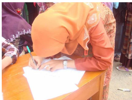
Gambar 3. Pengisian daftar Hadir

Salah satu upaya pemberdayaan dalam pengabdian ini dengan meningkatkan kemampuan masyarakat melalui sosialisasi. Sosialisasi berfungsi untuk menanamkan pengetahuan dalam mencapai tujuan kegiatan secara maksimal. Kegiatan sosialisasi diselenggarakan oleh tenaga pendamping dari PPH (Proses Produk Halal) dan dari tim abdimas berfungsi sebagai motivator bagi masyarakat yang datang dalam sosialisasi. Kegiatan ini secara luring dan diikuti oleh sejumlah kurang lebih 40 orang. Waktu pelaksanaan tanggal 1 Desember 2023, dimulai pukul 13.00 sampai selesai.