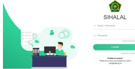
Gambar 10. Web SIHALAL