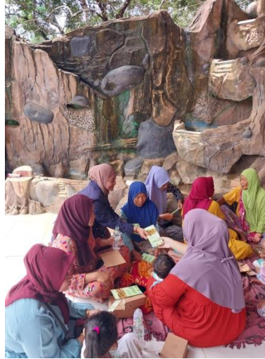
Gambar 4. Pembagian Brosur

mahasiswa memberikan brosur sertifikasi halal gratis ( SEHATI) kepada seluruh peserta yang hadir dalam sosialisasi tersebut.