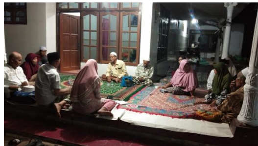
Gambar 2. Focus Group Discussion

Focus Group Discussion (FGD) atau diskusi kelompok terfokus merupakan suatu metode pengumpulan data yang lazim digunakan pada penelitian kualitatif sosial. Tidak terkecuali pada penelitian keperawatan. Metode ini mengandalkan perolehan data atau informasi dari suatu interaksi informan atau responden berdasarkan hasil diskusi dalam suatu kelompok yang berfokus untuk melakukan bahasan dalam menyelesaikan permasalahan tertentu. Focus Group Discussion (FGD) dilakukan sebagai upaya untuk mempercepat sertifikasi halal di Desa Pasanggar.