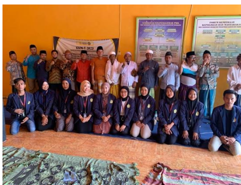
Gambar 7. Sosialisasi produk halal dan sertifikasi halal