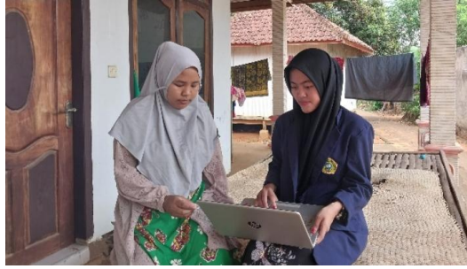
Gambar 8. Pendampingan Pembuatan Sertifikasi Halal