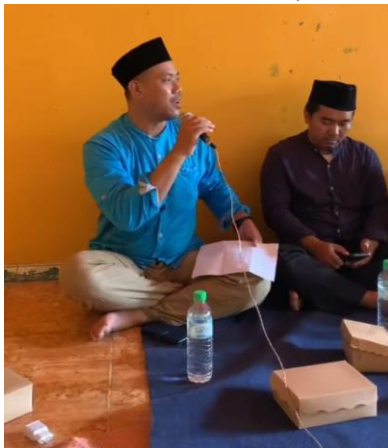
Gambar 6. Proses Produk Halal (PPH)

17 Oktober 2024 bagi pelaku usaha makanan dan minuman, hasil sembelihan, serta jasa penyembelihan, harus bersertifikasi halal. Jika belum, maka akan terkena sanksi.