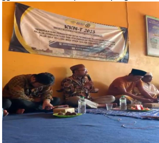
Gambar 5. Ketentuan syariat islam terkait JPH

Konsep haram pun juga harus dipahami sebelum menentukan makanan apa yang akan diproduksi dan atau dikonsumsi. Sesuatu yang haram adalah sesuatu yang dilarang menurut islam yang tercantum pada surat al- an'am ayat 145. Contoh barang yang dinyatakan haram adalah seluruh bagian tubuh babi, bangkai, darah, binatang bertaring, dan alkohol. Selain itu, haram juga melekat pada sesuatu yang najis baik berupa najis ringan, sedang dan berat. Pelaku usaha sebelum mengajukan diri untuk melakukan sertifikasi halal pada produk yang dihasilkan harus memahami bahwa produk yang halal itu bukan hanya dari bahan yang halal, melainkan juga menggunakan fasilitas produksi yang bebas dari najis.