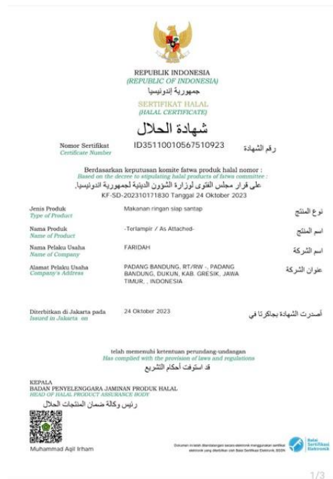
Gambar 15. Penerbitan sertifikasi halal produk