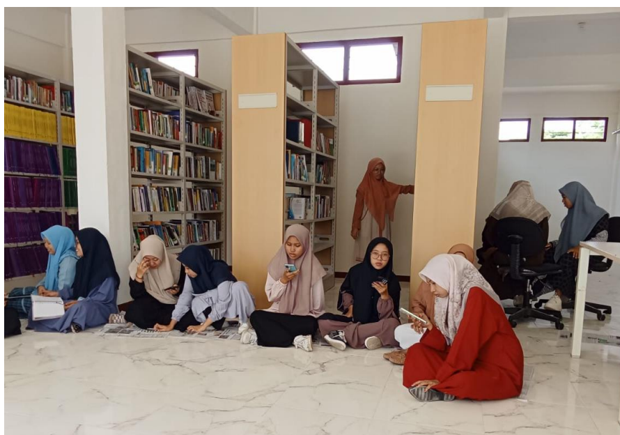
Gambar 3 : koordinasi dan persiapan program outing class

Selain melakukan kegiatan koordinasi, kegiatan mobilisasi juga dilakukan kepada masyarakat dampingan untuk berpartisipasi aktif dalam kegiatan agar target dan tujuan dari kegiatan pengabdian bisa tercapai, yaitu adanya peningkatan kemampuan berbicara bahasa arab mahasiswa. Berikut gambar koordinasi penyusunan program outing class.