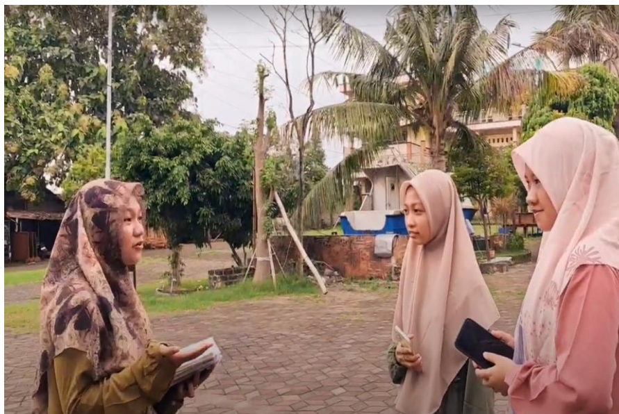
Gambar 4 : kegiatan outing class di taman kampus

taman dan tempat parkir. Berikut gambar mahasiswa praktik berbahasa arab outing class.