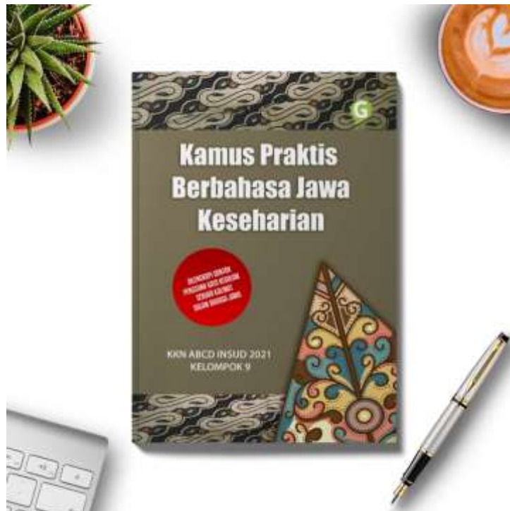
Gambar 4. Hasil Kamus Bahasa Jawa

Melakukan evaluasi terhadap naskah kamus yang telah dibuat dengan mengadakan mengadakan ujicoba kamus bahasa jawa melalui kegiatan belajar bahasa jawa bersama santri baru.