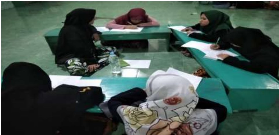
Gambar 2. Kegiatan Pendampingan Penghimpunan Kosakata bahasa jawa