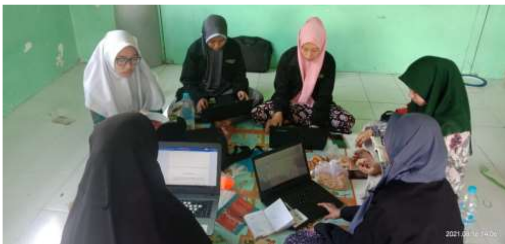
Gambar 3. Kegiatan Pendampingan Pengetikan naskah kamus bahasa jawa

Kegiatan keempat yaitu pengetikan kosakata dan kalimat-kalimat yang sudah terkumpul. Setelah proses pengetikan selesai, naskah kamus diserahkan kepada para pentashih untuk dikoreksi. Pengoreksian naskah ini dilakukan selama empat hari yakni dimulai dari tanggal 19 Agustus sampai 22 Agustus 2021.