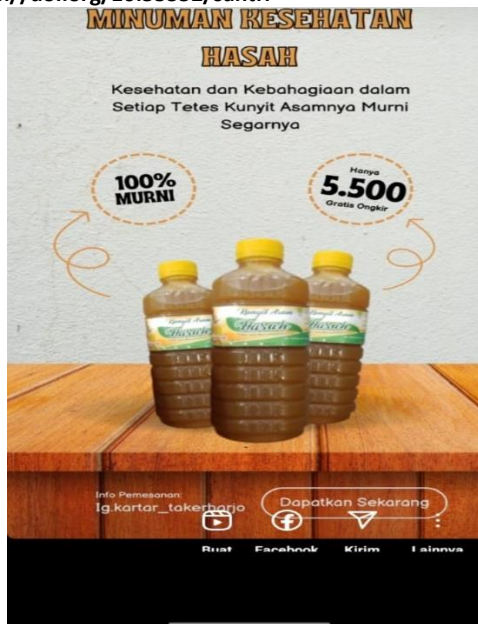
Gambar mempromosikan produk ke media sosial