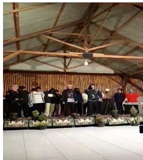
Gambar 9. Penampilan Masrohyyah (Drama) Bertajuk Palestina