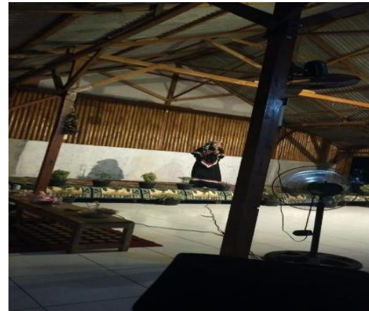
Gambar 7. Penampilan Pidato Bahasa Arab dengan tema Semangat pembebasan Palestina