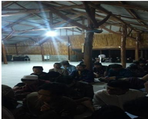
Gambar 6. Antusiasme Para Santri dan santriwati dalam menghadiri kegiatan Lailah Arabiyah