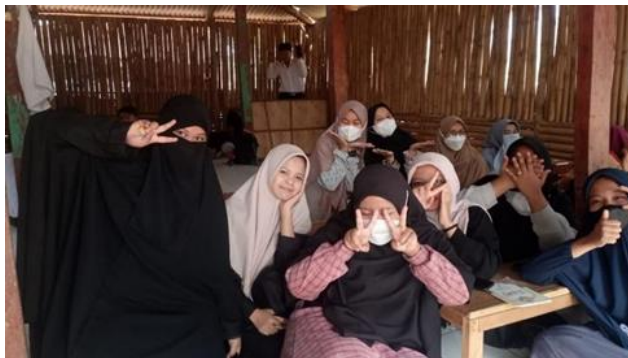
Gambar 3. Penentuan Bakal Santri yang akan tampil

Setelah melakukan tahapan kedua, kami mulai melakukan tahapan ketiga, yaitu action as solution (aksi sebagai solusi). Di hari esoknya, Ahad, 22 Oktober 2023, kami melakukan sosialisasi dan pengenalan terhadap kegiatan panggung kreasi bahasa arab lailah arabiyah yang akan dilangsungkan sebanyak 3 kali pada setiap malam jum'at. Maka acara lailah arabiyah akan mulai dilakukan pada kamis malam, 26 oktober 2023. Di kegiatan ini pula kami menjelaskan bahwa ada beberapa macam penampilan yang rencananya akan disuguhkan, antara lain, pidato bahasa arab, ghina' arobiy (menyanyi lagu arab), pembacaan sy'ir dan drama. Kami juga mengumumkan siapa saja kandidat calon penampil yang akan maju pada acara lailah arabiyah.