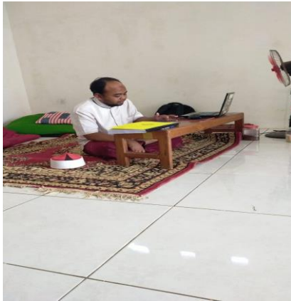
Gambar 1. In-deep interview bersama Pengasuh Pondok