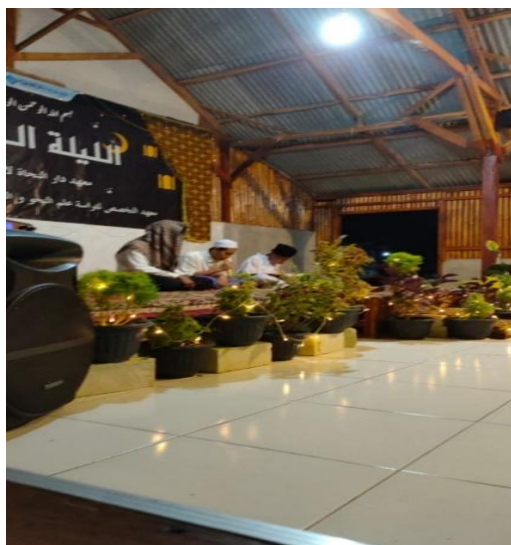
Gambar 8. Penampilan Tafsir Qur'an