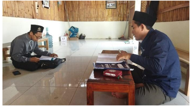
Gambar 2. In-deep Interview bersama Para ustadz Pengampu Mapel Bahasa Arab.