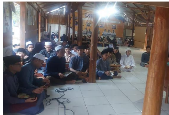
Gambar 4. Sosialisasi kegiatan panggung kreasi bahasa arab lailah arabiyah