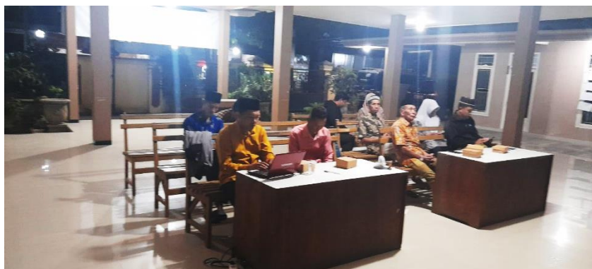
Gambar 2. Pemaparan Aplikasi SPPS untuk laporan data statistik