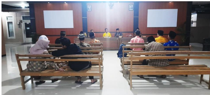
Gambar 1. Perkenalan Kepada Semua Pihak Terkait Dalam PILKADES Sukorejo

Kegiatan dilakukan dengan memperkenalkan diri kepada panitia pilkades beserta perangkat desa Sukorejo serta mengenalkan aplikasi statistik SPSS kepada pihak Pemerintahan Desa, Panitia Pemilihan Kepala Desa, dan Badan Permusyawaratan Desa, pada tanggal 5 Oktober 2023. Dari hasil pemaparan aplikasi semua pihak yang berhubungan setuju untuk menggunakan aplikasi SPPS dalam pembuatan data laporan.